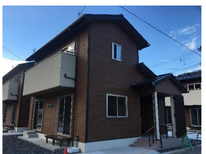
岩手縣大槌町町芳公營住宅落成