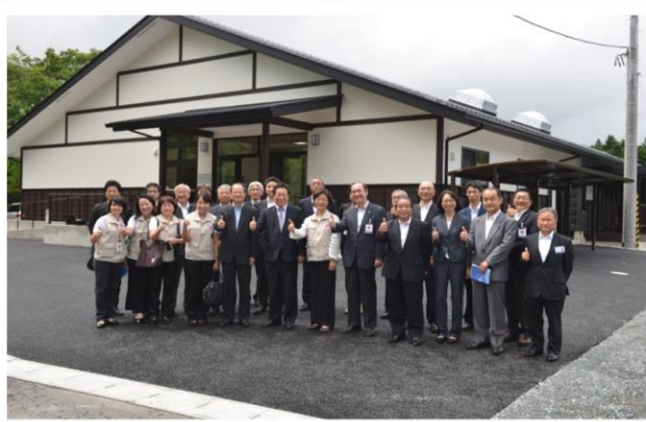
本會援建福島縣相馬市公營老人住宅，獲得日本優良建築「全建賞」住宅類獎。本住宅為「井戸端長屋」，以江戶時代「共用一口井洗衣」特色為設計理念，透過高齡者共同生活，預防孤獨感