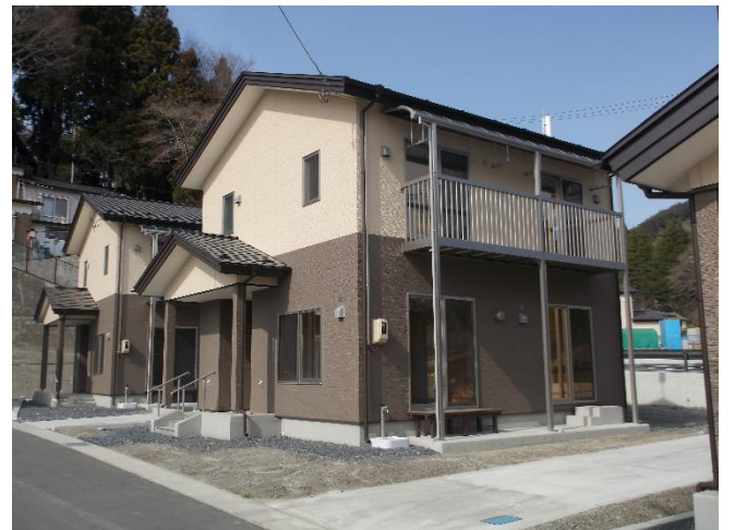
2019年11月大槌町安渡B2公営住宅落成