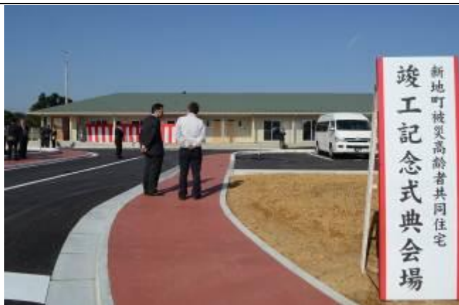
102 年 11 月 6 日舉辦完工典禮的福島縣新地町公營老人住宅落成典禮