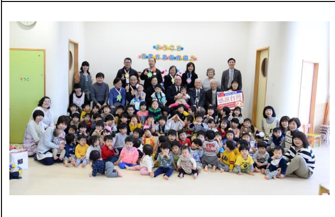
吉里吉里園內 60 多個孩子都獲得悉心照顧