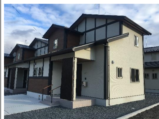
岩手縣大槌町町方公營住宅落成