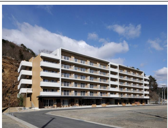
岩手縣末廣町公營住宅落成