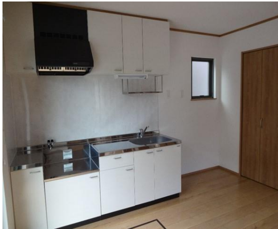
赤浜1号公営住宅内部設計一隅