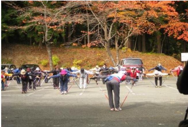
秋節過後居民參加社區所舉辦的北歐式健走