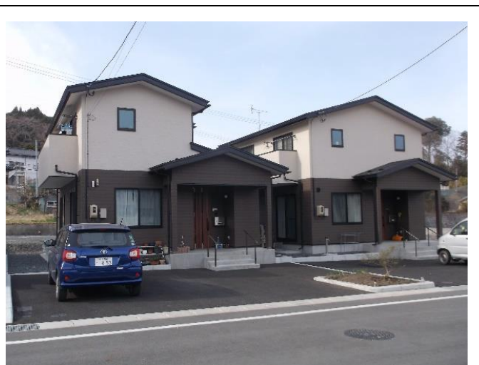
岩手縣大槌打吉里吉里公營住宅落成