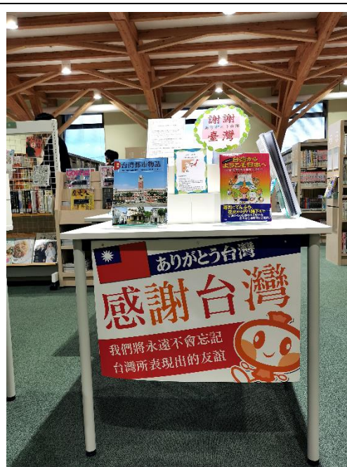
大槌町文化交流中心圖書館中的台灣展覽區