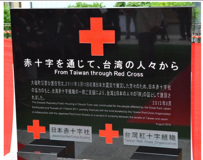
大槌町長碓川豊以「雨停後，不要忘了傘」這句古諺，表達日本對台灣311賑災無盡的感謝