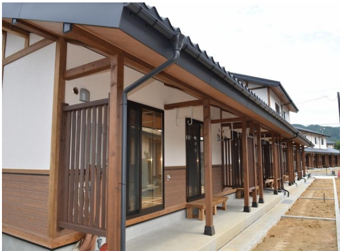
岩手縣大槌町大ヶ口社區(Ogakuchi) 70戶公營住宅於102年8月底正式啟用