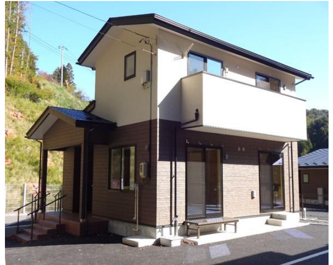
2019年11月大槌町赤浜1号公営住宅落成