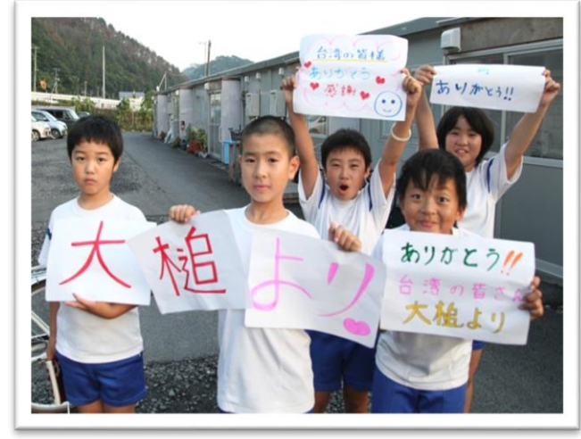
臨時組合屋的孩童，向我國援助者表達感謝