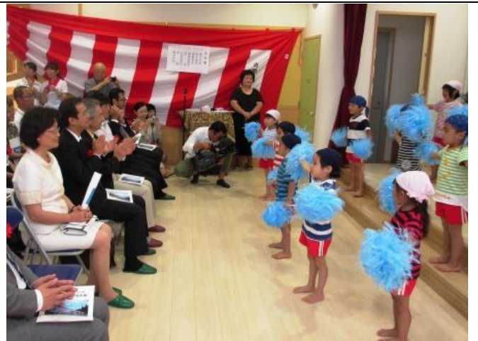
王會長參觀吉里吉里保育園落成典禮兒童表演