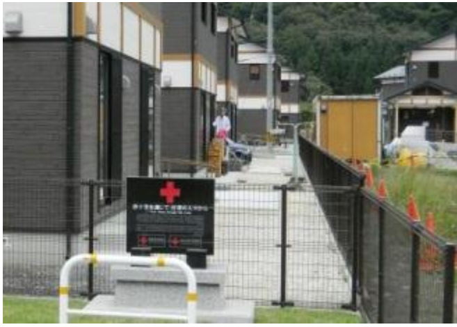
岩手縣大槌町公營住宅落成紀念牌感謝台灣