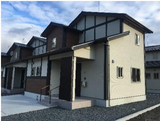
2019年2月大槌町町方3号公営住宅落成