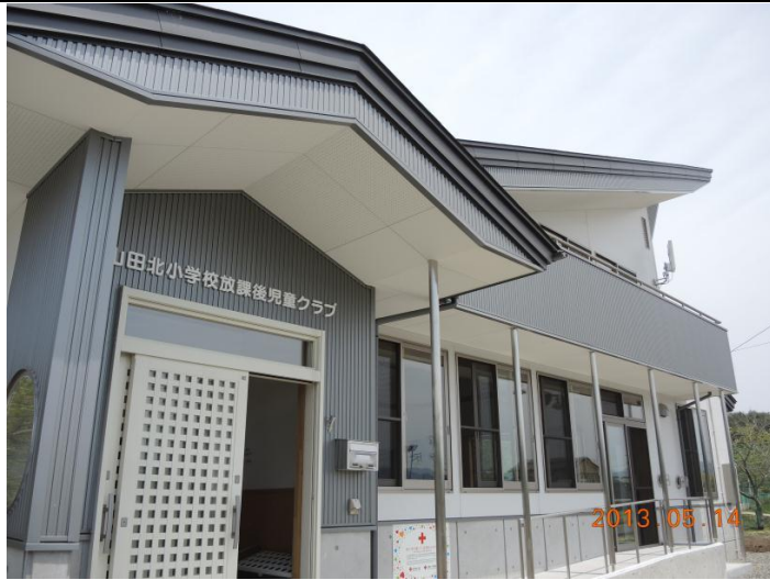
103 年 5 月 14 日新落成啟用的岩手縣山田町山田北課輔中心