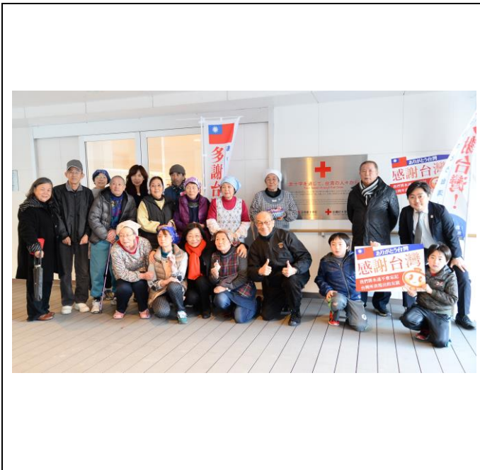
町方末廣公營住宅居民們發自肺腑地感謝台灣