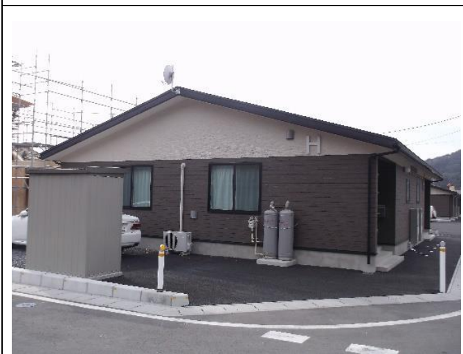
岩手縣大槌打赤濱公營住宅落成