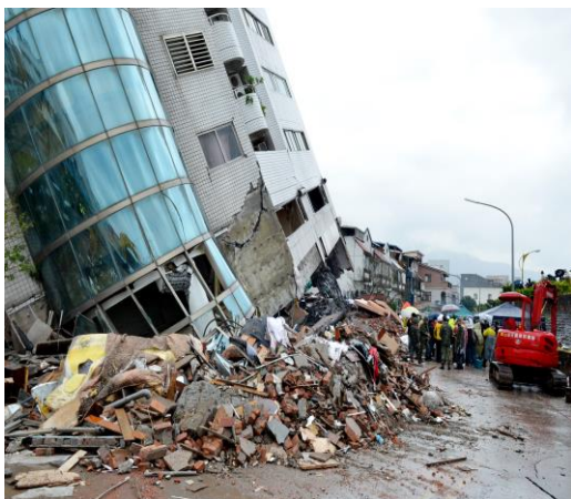
花蓮大地震造成雲門翠堤大樓倒塌