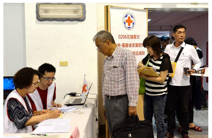
核對慰問補助發放名冊