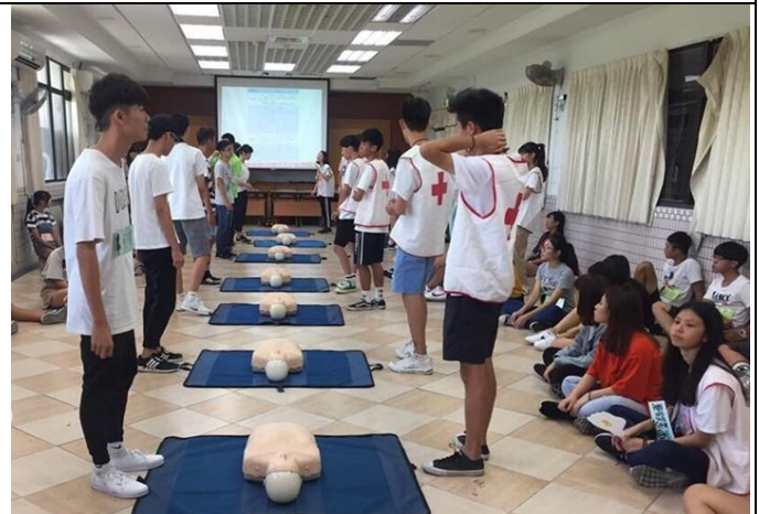
高中新生學習急救知識與技能