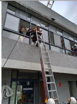
基礎搜救高低所訓練