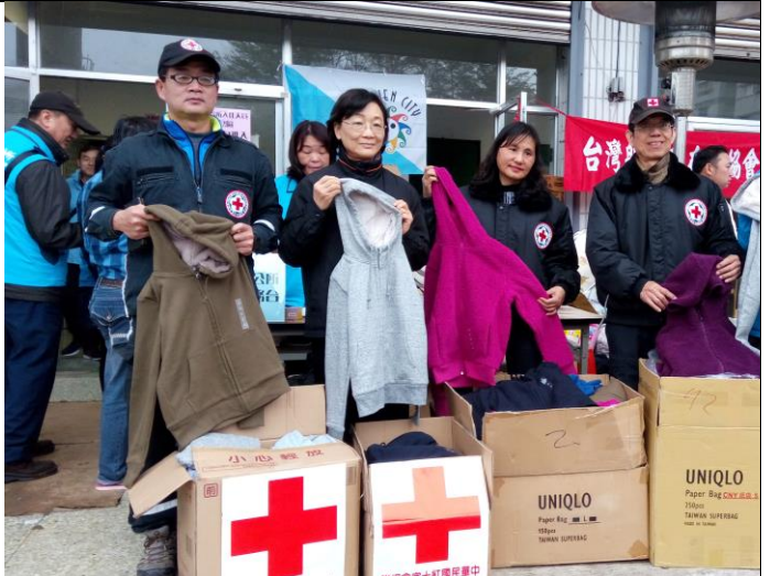
捐贈緊急賑濟物資