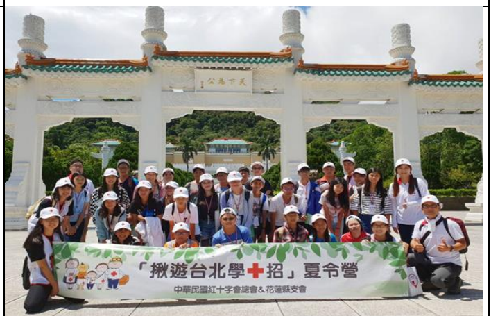
花蓮學生參訪故宮博物院認識歷史及文化財產