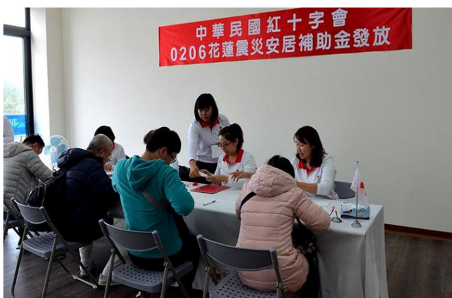
108年2月17日假花蓮備災中心發放安居補助