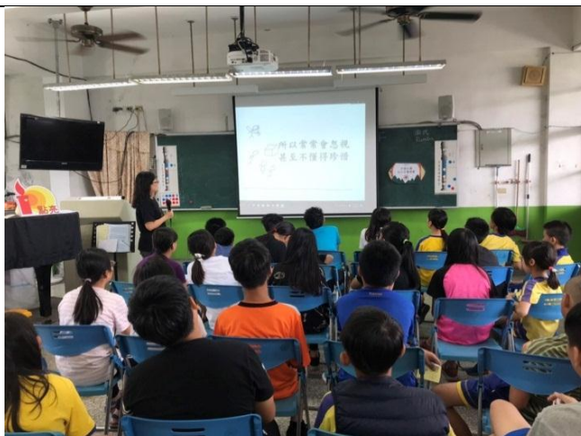
辦理生命教育校園巡迴講座