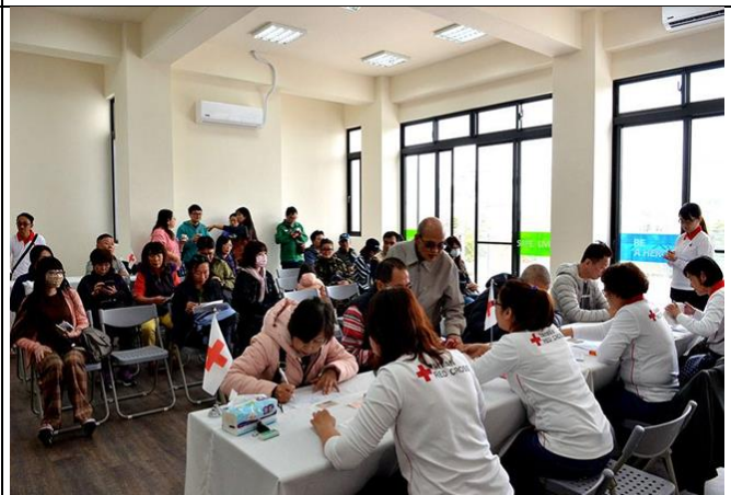
108年2月17日發放安居補助，逐戶核對資料 簽領支票