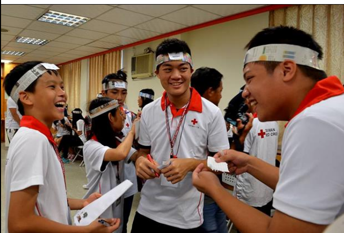
透過遊戲教導學員「認識差異、反歧視、同理心的養成」