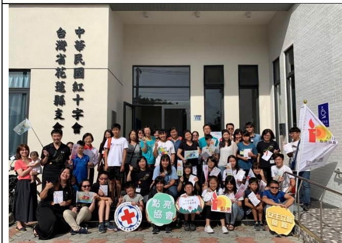
本會與點亮生命教育協會合作辦理安「生」立命營隊