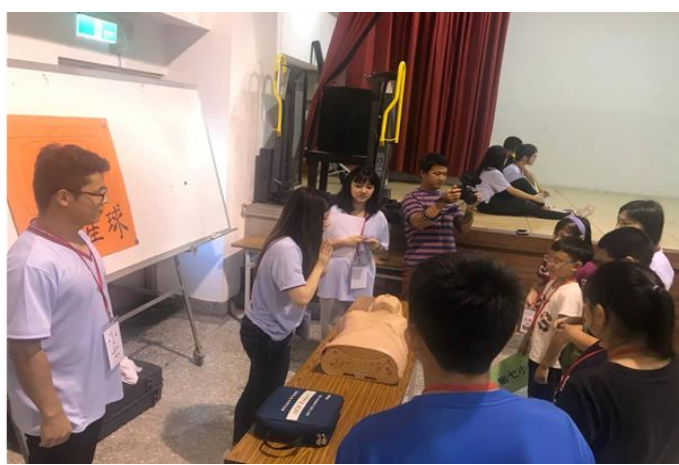
大專青年為小學生設計急救闖關活動寓教於樂