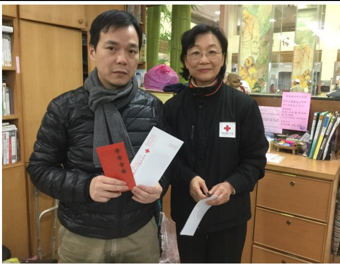
至花蓮慈濟醫院慰問受傷民眾