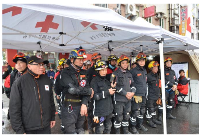
救災隊整裝集合備便進入災區搜救