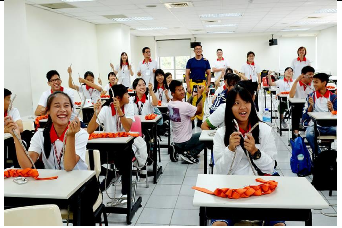
繩結變化多端，學員從最簡單的平結開始練習