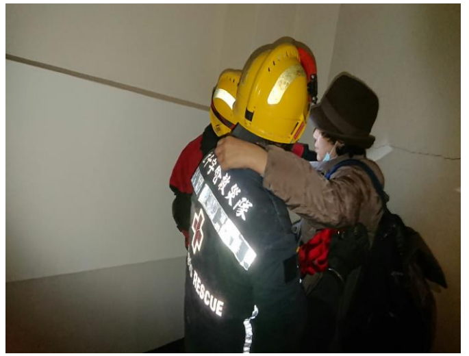
雲門翠堤大樓救出韓籍民眾