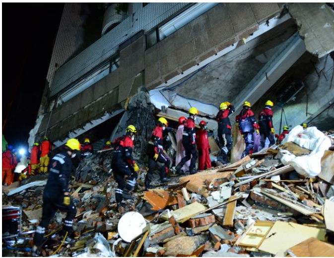
救災隊進入雲門翠堤大樓搜救