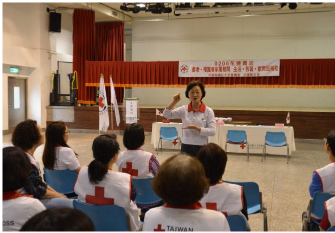
慰問補助金發放前工作提示與說明