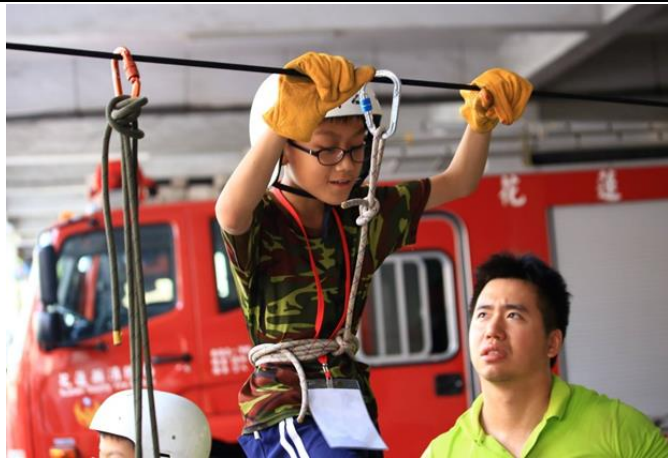
學員到花蓮縣消防局進行繩索體驗