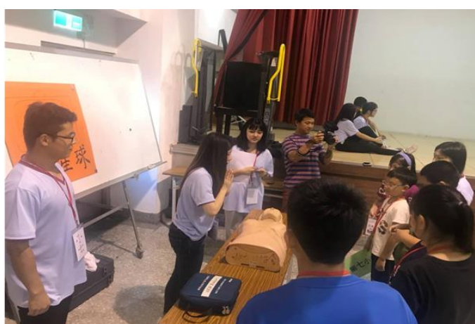
大專青年為小學生設計急救闖關活動寓教於樂