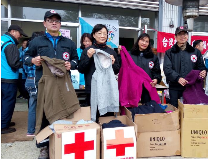
捐贈緊急賑濟物資