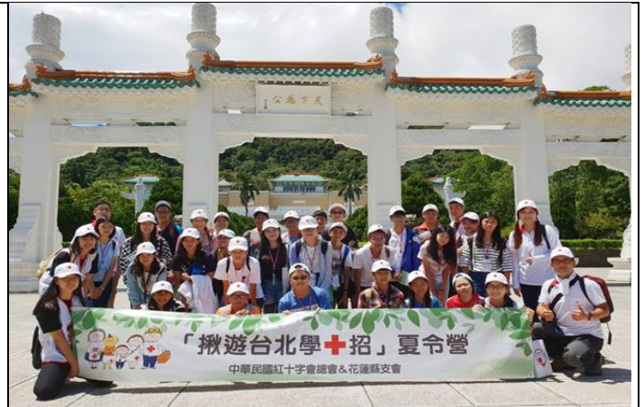
花蓮學生參訪故宮博物院認識歷史及文化財產