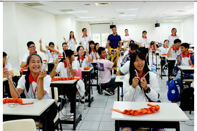
繩結變化多端，學員從最簡單的平結開始練習