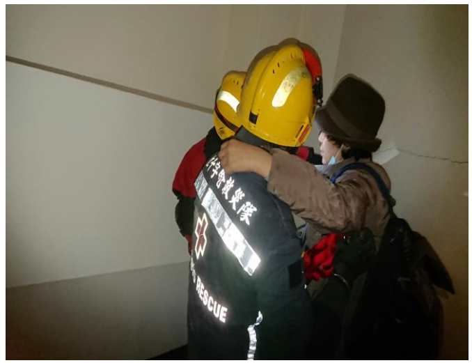
雲門翠堤大樓救出韓籍民眾