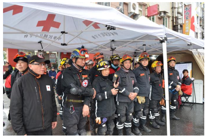
救災隊整裝集合備便進入災區搜救