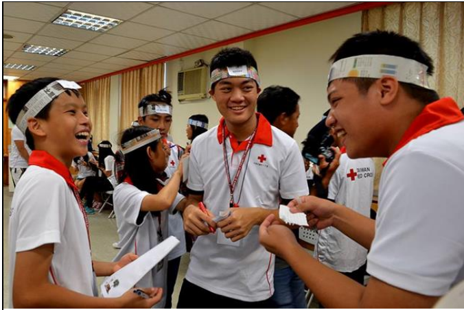
透過遊戲教導學員「認識差異、反歧視、同理心的養成」