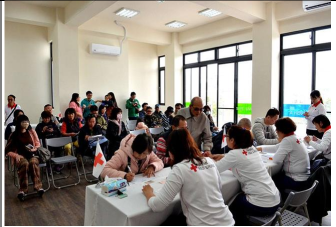
108年2月17日發放安居補助，逐戶核對資料 簽領支票