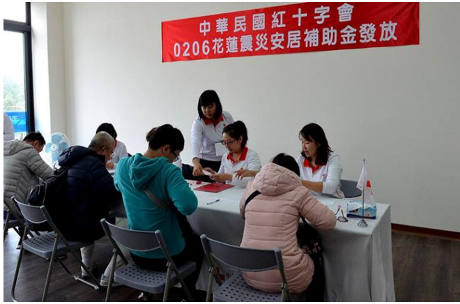
108年2月17日假花蓮備災中心發放安居補助