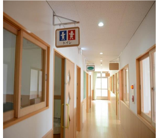
團員自由參觀內部設施、都覺得這間保育園的設備規畫相當完整