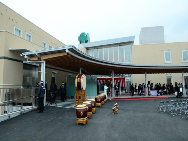
町立南三陸醫院外觀