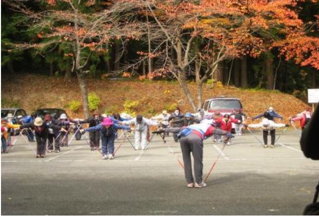
秋節過後居民參加社區所舉辦的北歐式健走