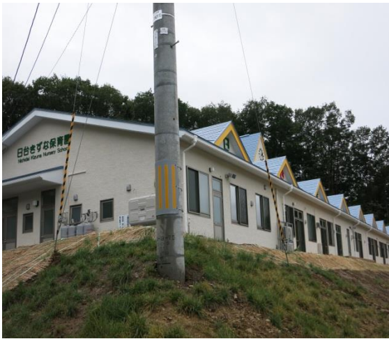
02年10月7日舉辦完工典禮的岩手縣山田町日台の絆保育園