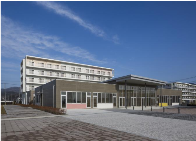
氣仙沼市市民福祉館外觀