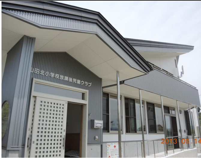
103 年 5 月 14 日新落成啟用的岩手縣山田町山田北課輔中心

104 年 1 月 23 日本會與日本赤十字社重建計畫協議書第四次修訂簽署完畢。 7. 綜合業務尚未支用款項，自 105 年度起，陸續包括岩手縣大槌町公營住宅及宮城縣氣仙沼市民福祉館等陸續完工落成，本會亦將擇要赴日參加竣工典禮及訪視援建，以為責信。其中宮城縣氣仙沼市民福祉館已於 106 年 4 月 14 日啟用，岩手縣大槌町 658 戶公營住宅，已完成 623 戶，餘因土地取得、設計規劃及施工等因素，全部專案項目日本赤十字社預計要到 108 年執行完畢。