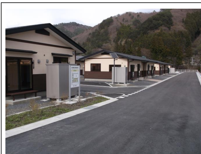
岩手縣大槌町柁内公營住宅落成