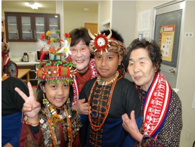
泰武國小古謠傳唱隊，赴日慰問當地受災長者