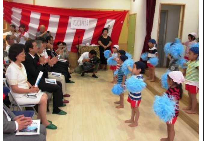
王會長參觀吉里吉里保育園落成典禮兒童表演