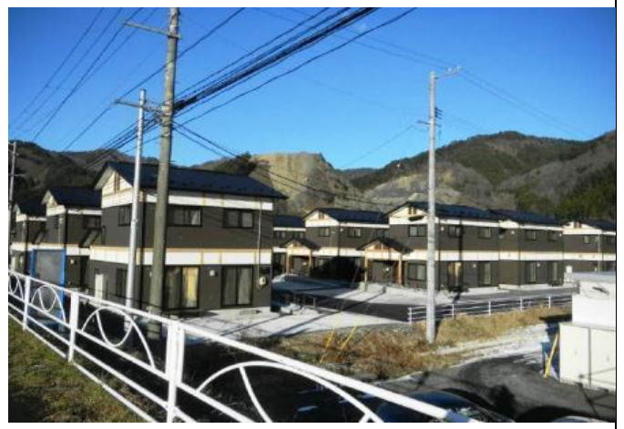
岩手縣大槌町 Masanai 公營住宅落成