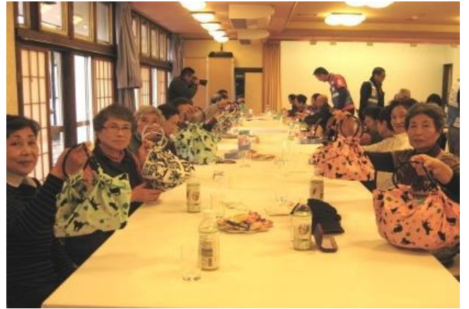
北歐式健走後居民參加午餐以及日本傳統包袱布手工藝品展