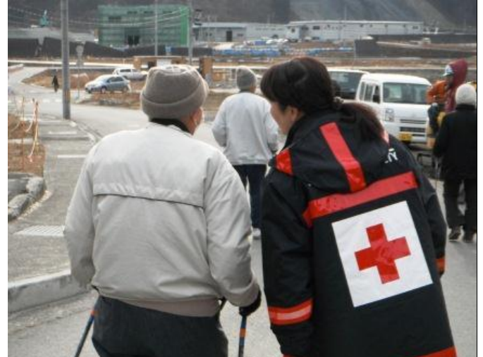
紅十字會志工緊密的陪伴著災後居民