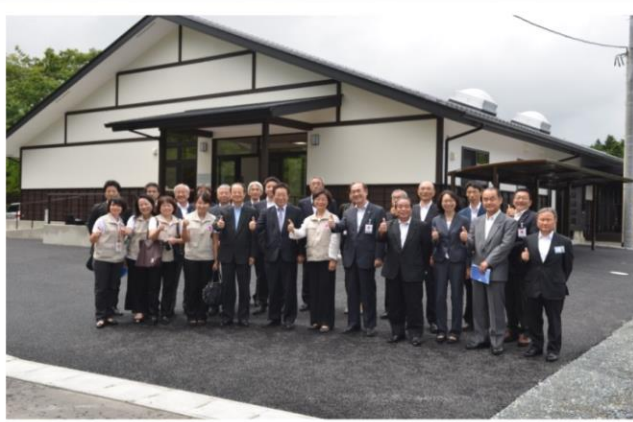
本會援建福島縣相馬市公營老人住宅，獲得日本優良建築「全建賞」住宅類獎。本住宅為「井戸端長屋」，以江戶時代「共用一口井洗衣」特色為設計理念，透過高齡者共同生活，預防孤獨感