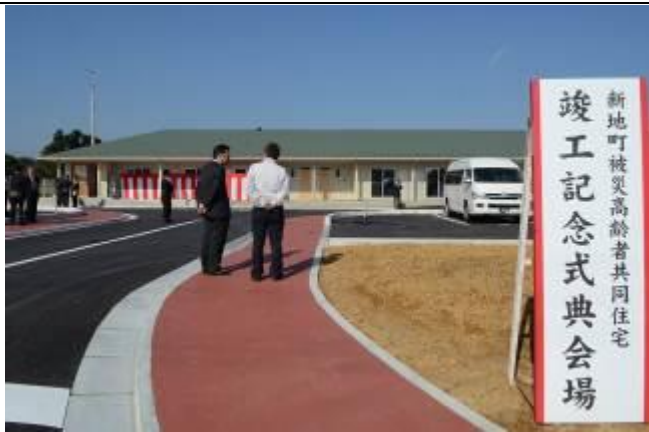
102 年 11 月 6 日舉辦完工典禮的福島縣新地町公營老人住宅落成典禮