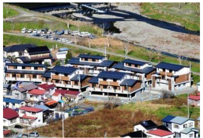
岩手縣大槌町 Gensui 公營住宅落成