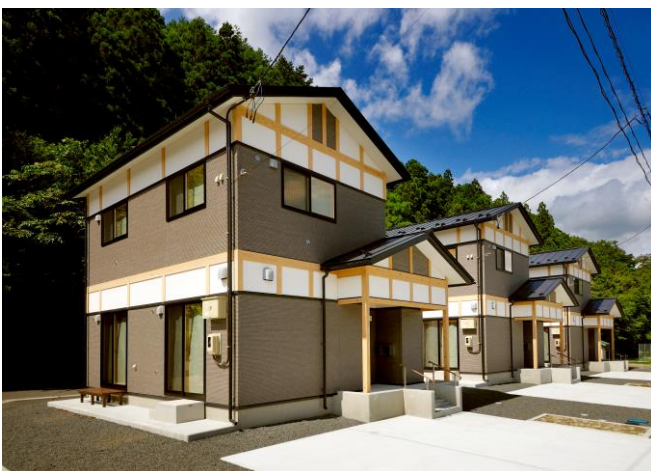
岩手縣大槌町寺野公營住宅落成