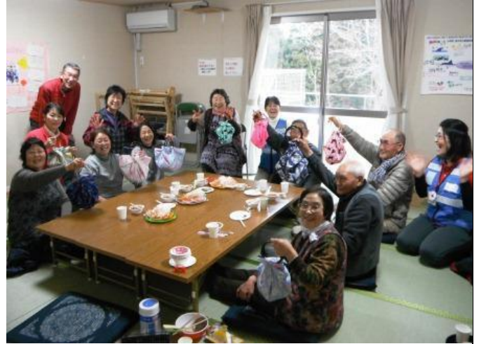
參加活動的災後居民都很滿意自己手工藝作品