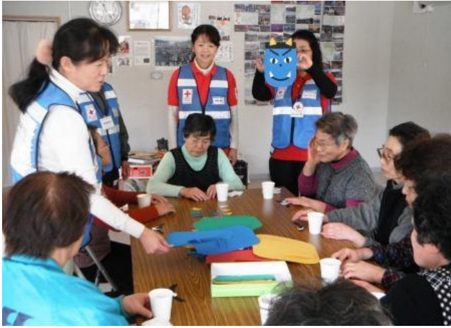
參加活動的災後居民開心地學習手工藝製作