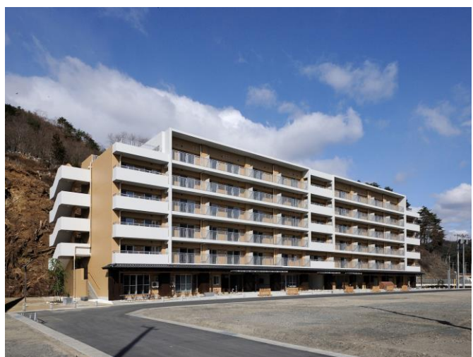
岩手縣末廣町公營住宅落成