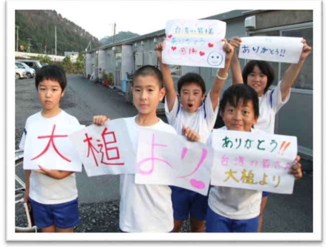
臨時組合屋的孩童，向我國援助者表達感謝