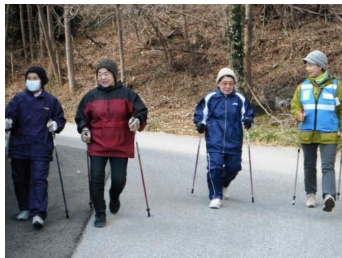
仍住在臨時住所的居民繼續北歐式健走鍛煉