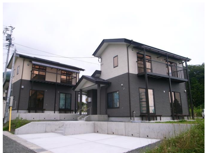
岩手縣大槌町浪板公營住宅落成