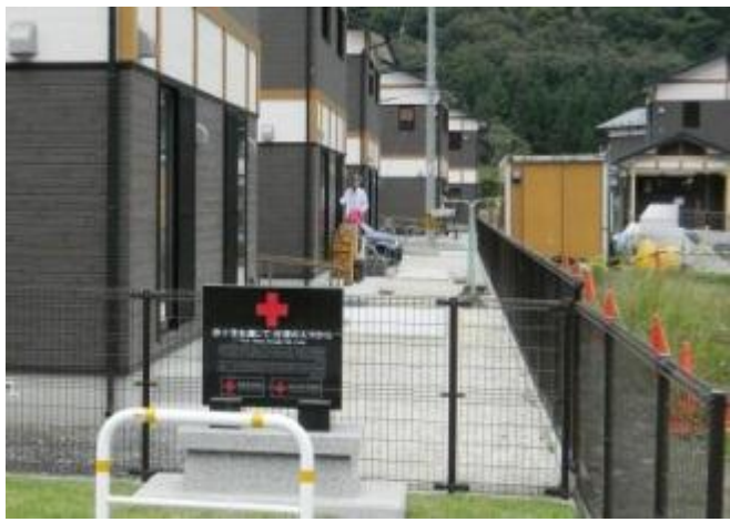
岩手縣大槌町公營住宅落成紀念牌感謝台灣