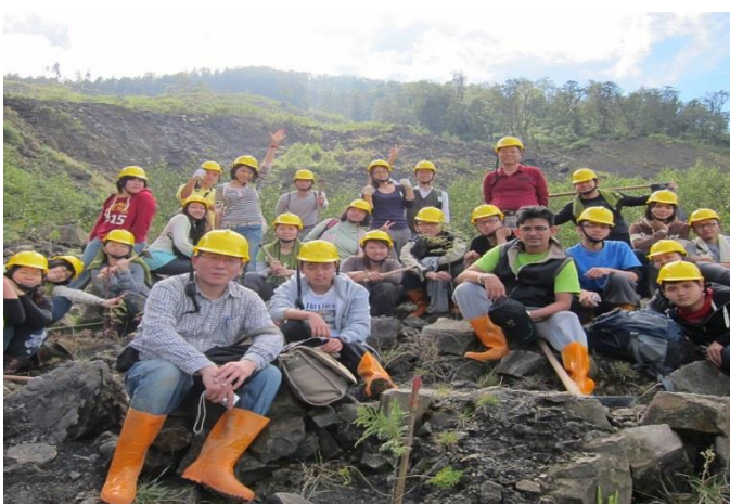
本會於災區與當地居民共同造林，保育大地母親