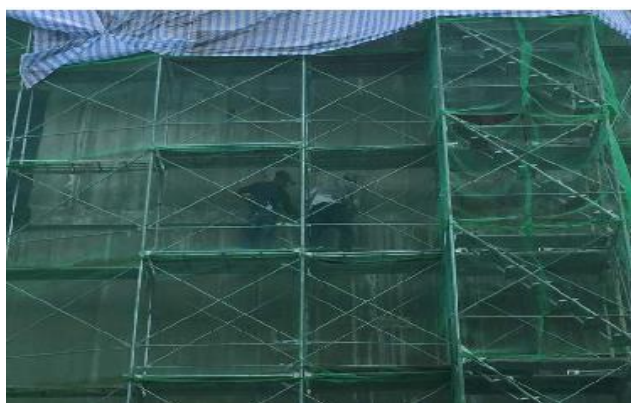
嘉義備災中心外牆塗料施作