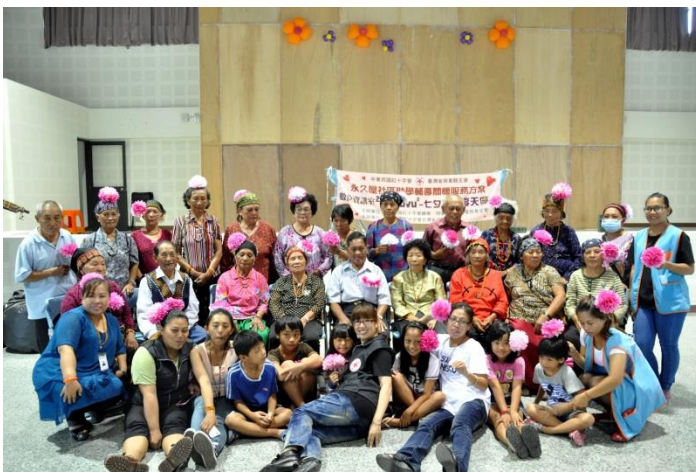
本會在吾拉魯滋部落推行老幼共學，透過日間關懷透過活動讓長者與稚兒更加親近，帶入年輕活力，傳承生命經驗與智慧