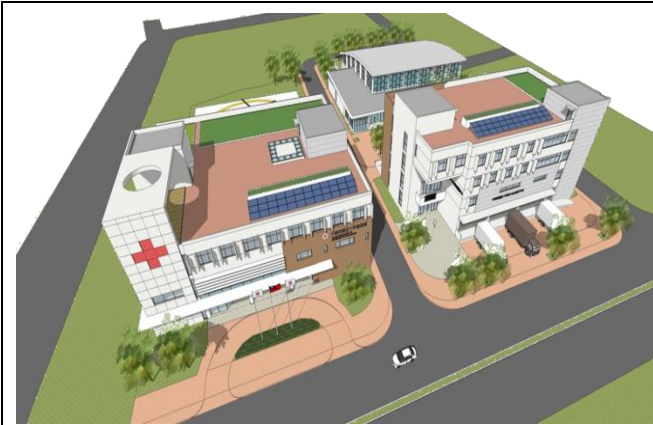
大台北備災中心規劃設計優勝廠商作品