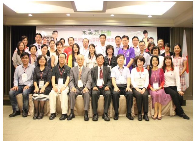
「水芙蓉回顧與展望座談會暨績優學校表揚」活動，為期 2 年的特色教學計畫畫下圓滿句點