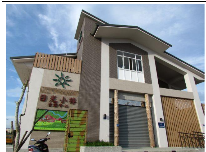
除了永久屋，本會也興建社區內的活動中心、產銷中心等設施，提供居民完善的社區空間