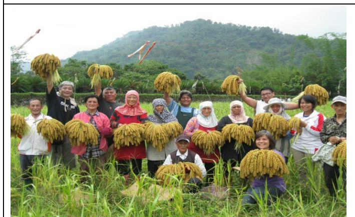
本會補助茶山雜糧產銷班小米收成，大家好開心