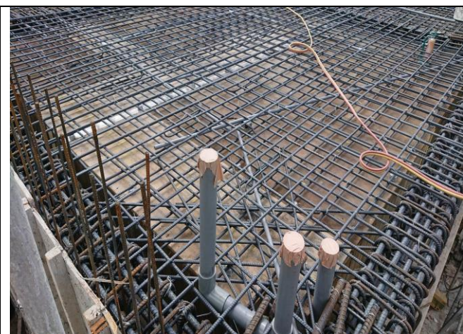
花蓮備災中心二樓底板施工狀況