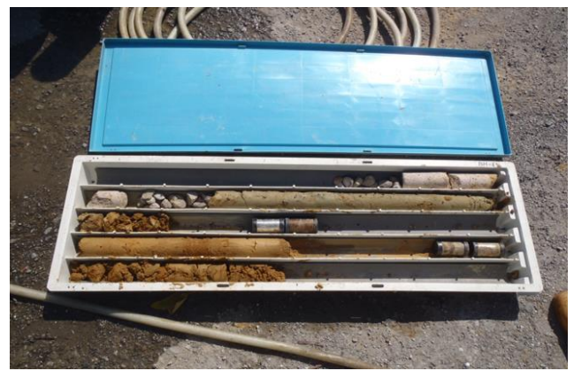
大台北備災中心地質鑽探土壤取樣圖