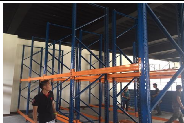
嘉義備災中心庫房物資儲存架