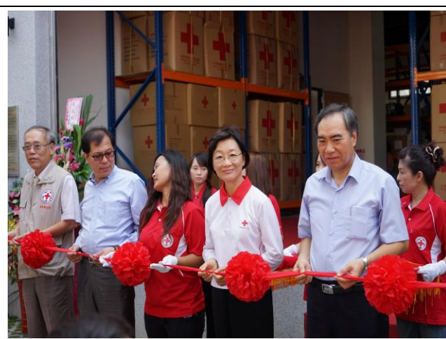
嘉義備災中心落成啟用剪綵