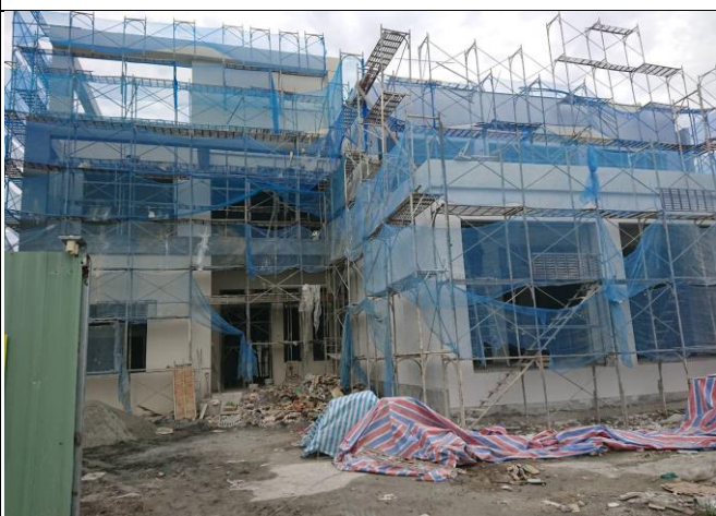
花蓮備災中心正面外觀施工狀況