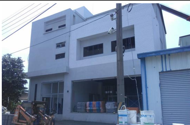
嘉義備災中心正面施作狀況