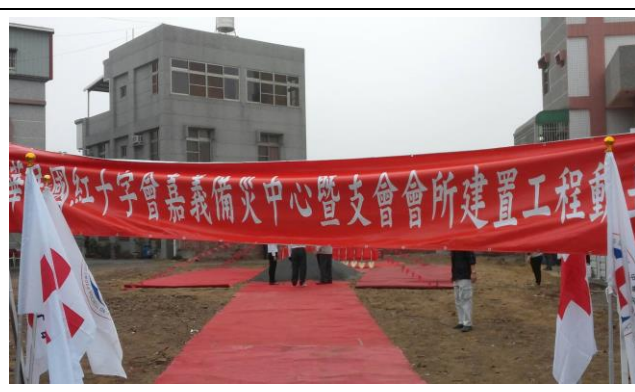
嘉義備災中心動土開工典禮