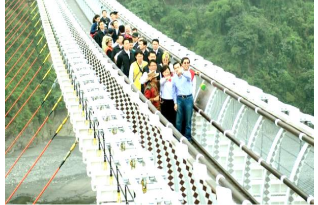
本會援建屏東縣三地門鄉山川琉璃吊橋，全長 263.25 公尺，是全國最長且優美的臥床式吊橋