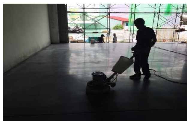
嘉義備災中心超耐磨地坪收尾