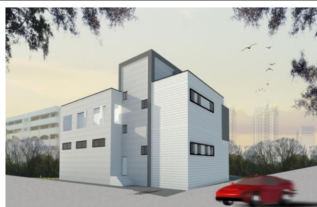
花蓮備災中心背面立面圖