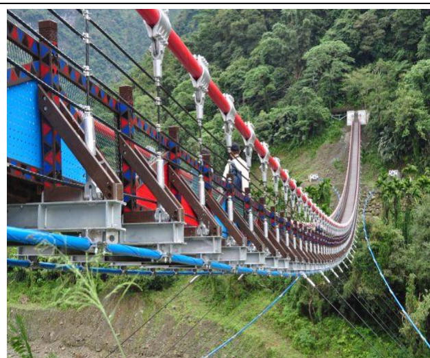
本會援建嘉義縣阿里山鄉福美吊橋，全長 176 公尺，是一座相當美的垂索式吊橋