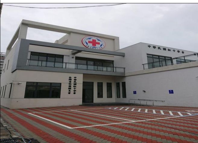
花蓮備災中心正面外觀