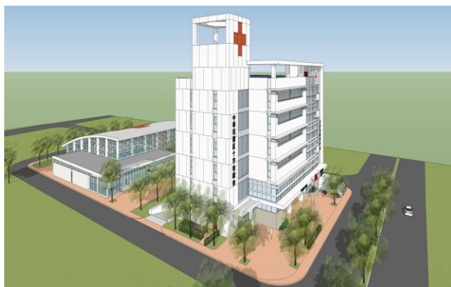
大台北備災中心變更規劃設計透視圖(2)