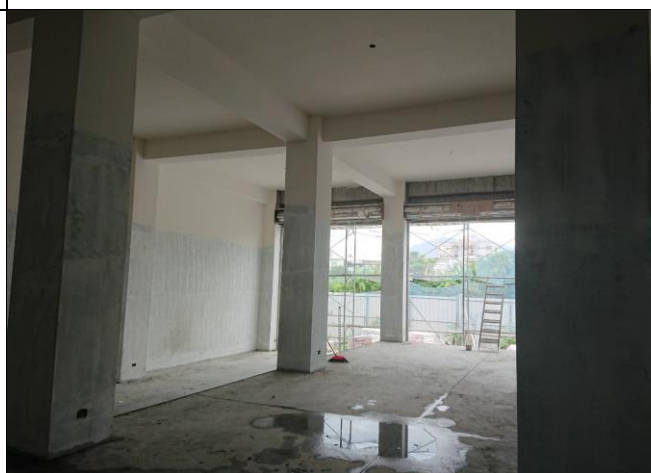
花蓮備災中心備災中心庫房施工狀況