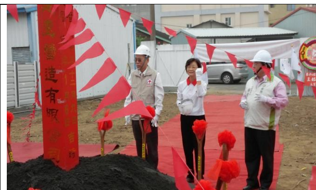
嘉義備災中心動土開工典禮