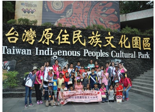
本會於重建區辦理排灣族兒童文化列車活動，建立自我文化認同、促進原民文化傳承