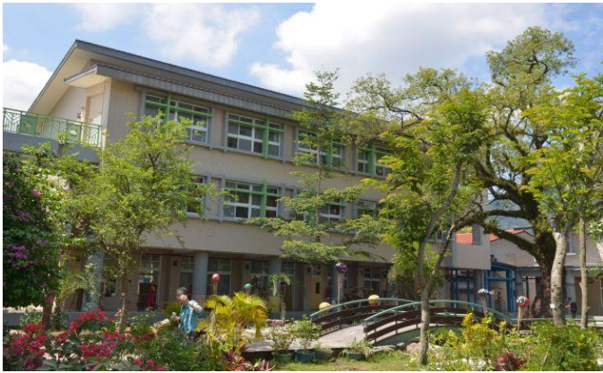
本會協助興建高雄市龍興國小，好漂亮的校舍