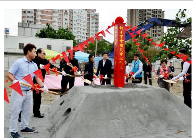
花蓮備災中心開工動土典禮