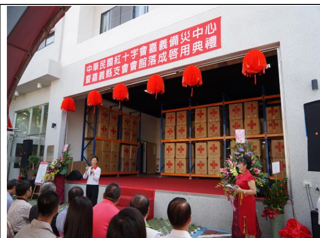
嘉義備災中心落成啟用