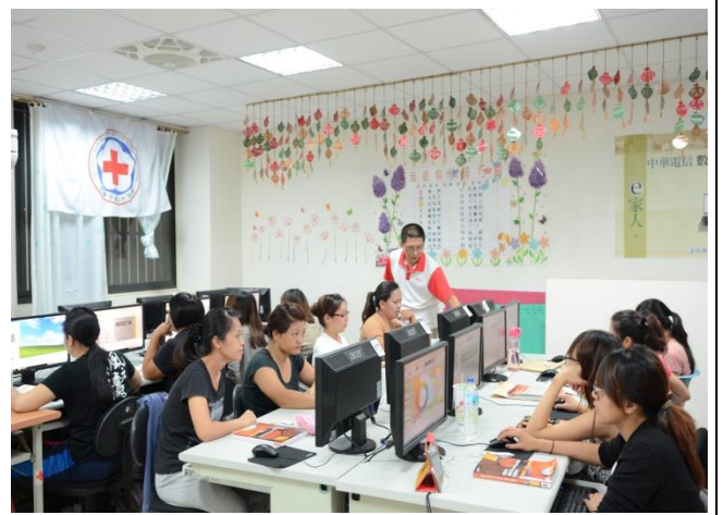
本會在屏東永久屋社區新來義部落推行數位輔導關懷陪伴工作，鼓勵婦女及孩童積極面對數位科技