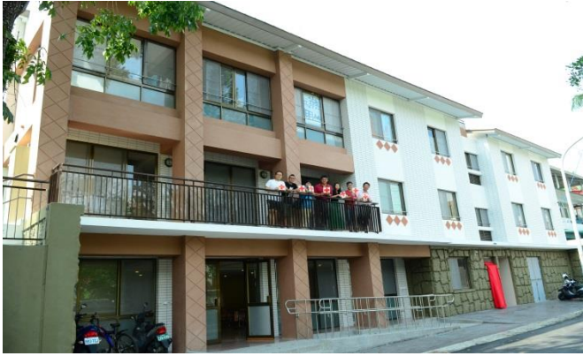
本會協助興建高雄市甲仙國中教職員宿舍，讓作育英才的老師們，在學校裡也有個家