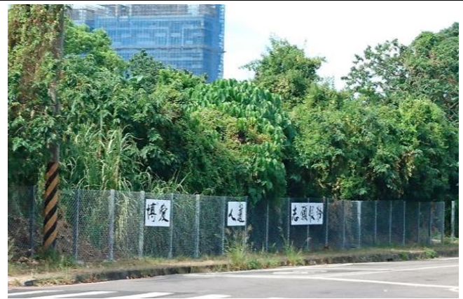
大台北備災中心圍籬網設置紅十字會宗旨標示牌