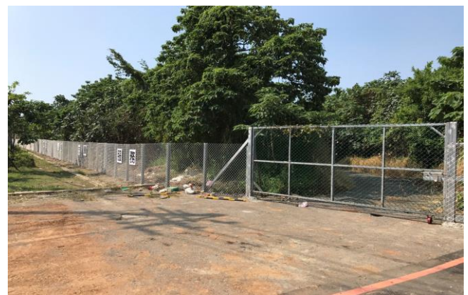
大台北備災中心簡易圍籬設置工程