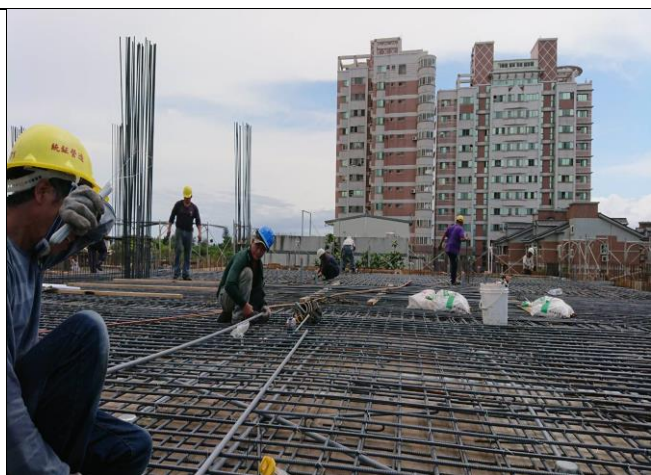
花蓮備災中心二樓底板施工狀況