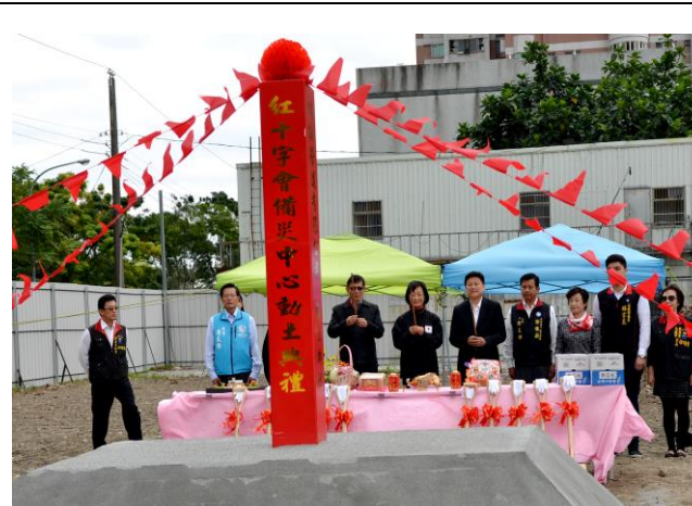
花蓮備災中心開工動土典禮