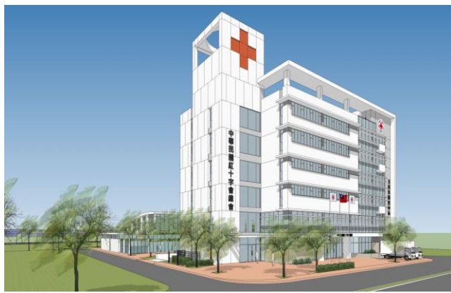
大台北備災中心變更規劃設計透視圖(1)