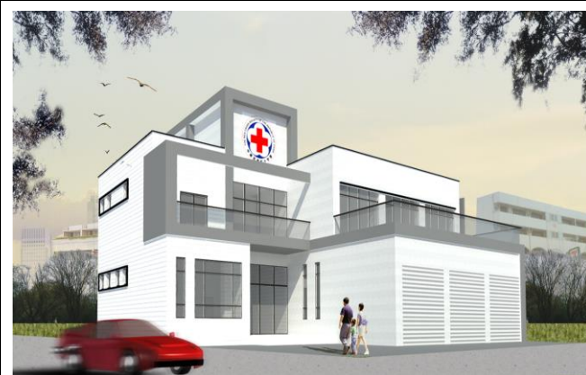
花蓮備災中心正面立面圖