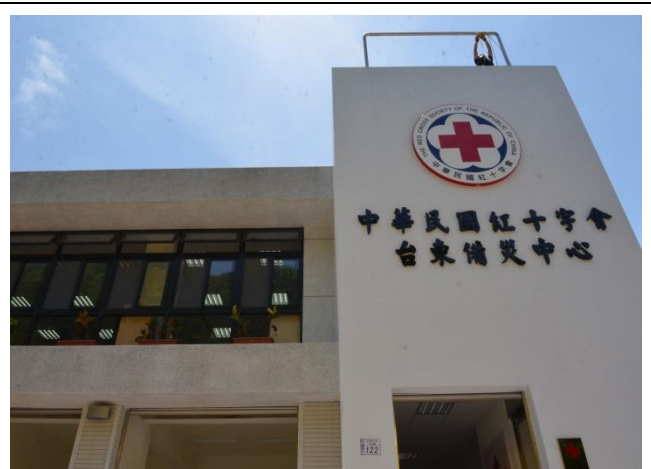
本會首次建置自有之台東備災中心