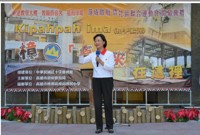
本會援建高雄市桃源區南橫公路上最偏遠之樟山國小，距左營高鐵還要 2 個半小時的車程