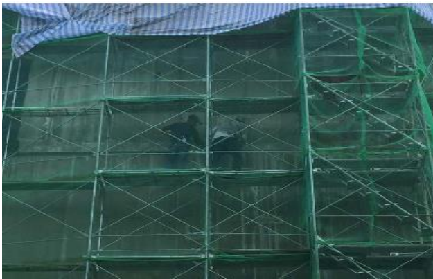
嘉義備災中心外牆塗料施作