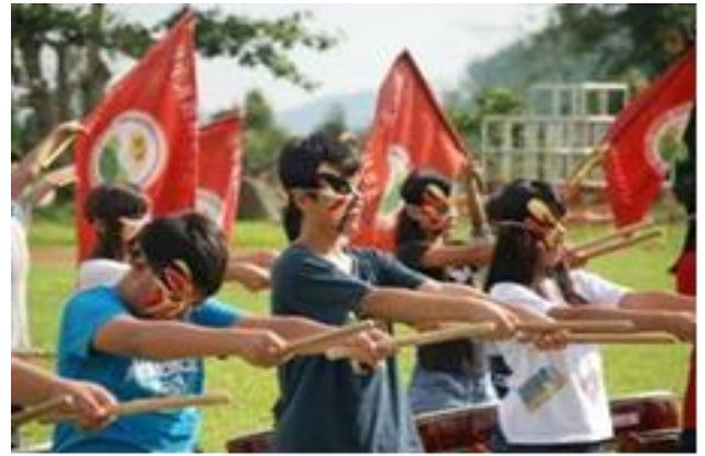
高雄市杉林國小融入創新的鼓術教學