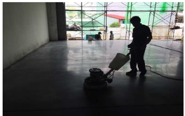
嘉義備災中心超耐磨地坪收尾