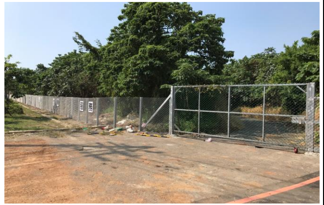
大台北備災中心簡易圍籬設置工程