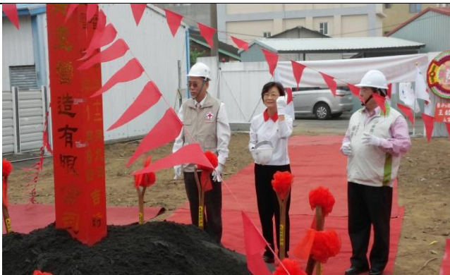
嘉義備災中心動土開工典禮