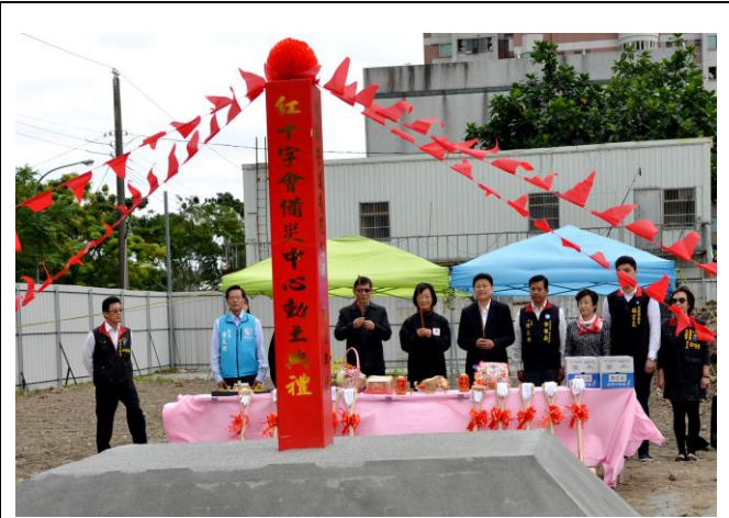
花蓮備災中心開工動土典禮