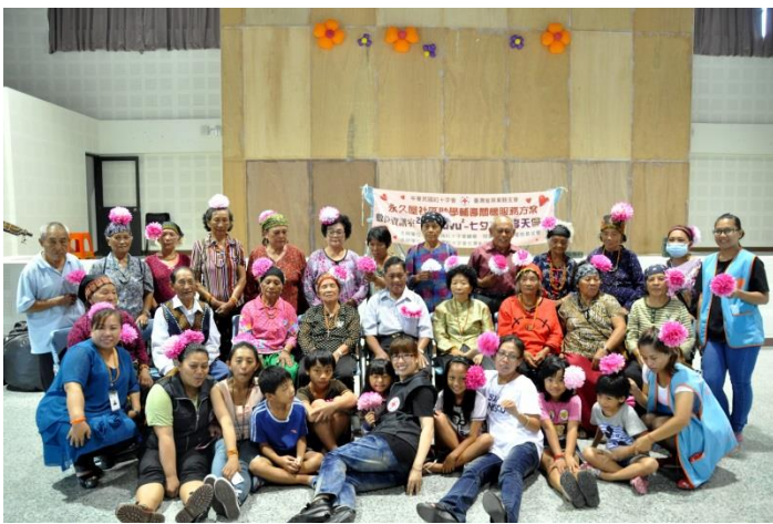
本會在吾拉魯滋部落推行老幼共學，透過日間關懷透過活動讓長者與稚兒更加親近，帶入年輕活力，傳承生命經驗與智慧