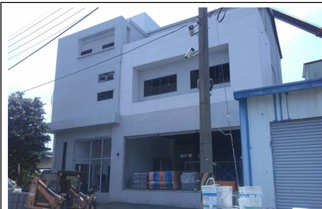
嘉義備災中心正面施作狀況