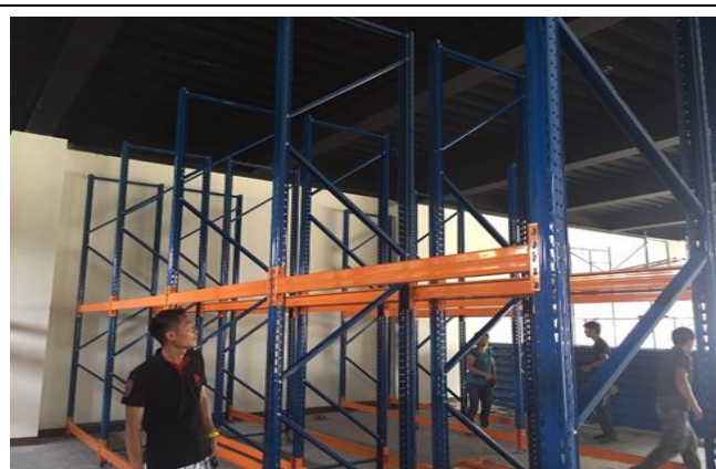
嘉義備災中心庫房物資儲存架