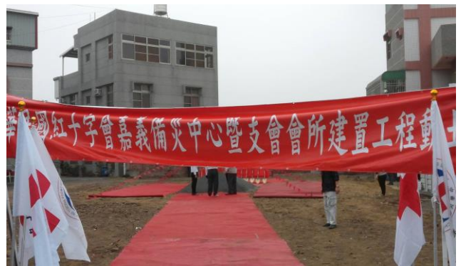
嘉義備災中心動土開工典禮