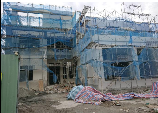
花蓮備災中心正面外觀施工狀況