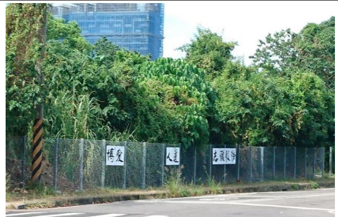
大台北備災中心圍籬網設置紅十字會宗旨標示牌