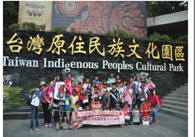
本會於重建區辦理排灣族兒童文化列車活動，建立自我文化認同、促進原民族文化傳承