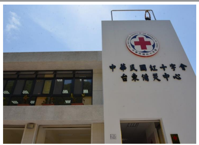
本會首次建置自有之台東備災中心