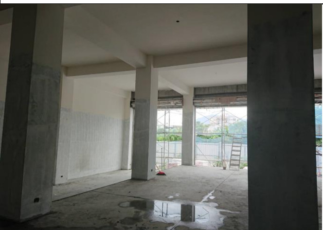
花蓮備災中心備災中心庫房施工狀況