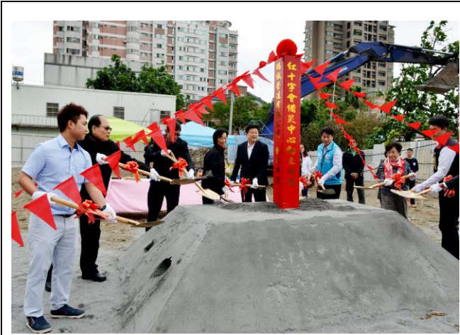
花蓮備災中心開工動土典禮