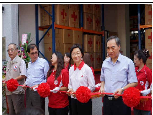
嘉義備災中心落成啟用剪綵