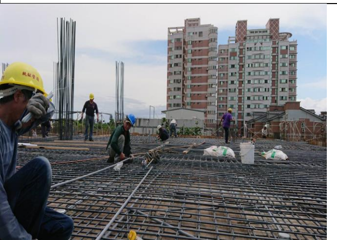
花蓮備災中心二樓底板施工狀況