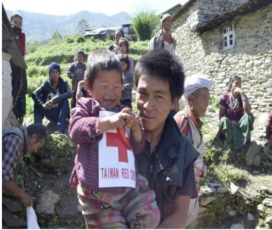
高山區紅會搭機來賑濟，小孩破涕為笑