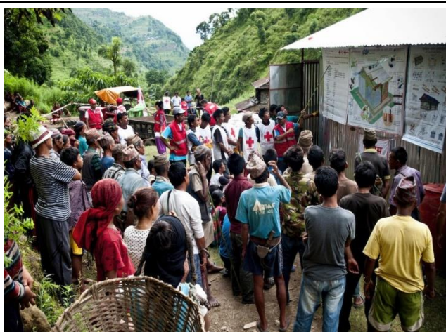
工作人員向災民說明耐久屋之構型設計