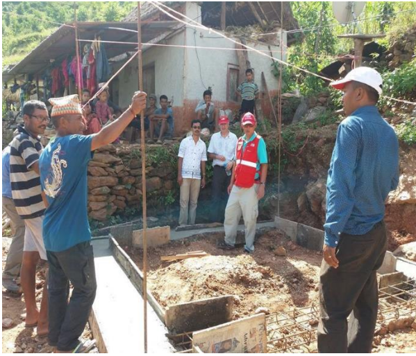
同心合力為新屋打造穩固及抗震地基