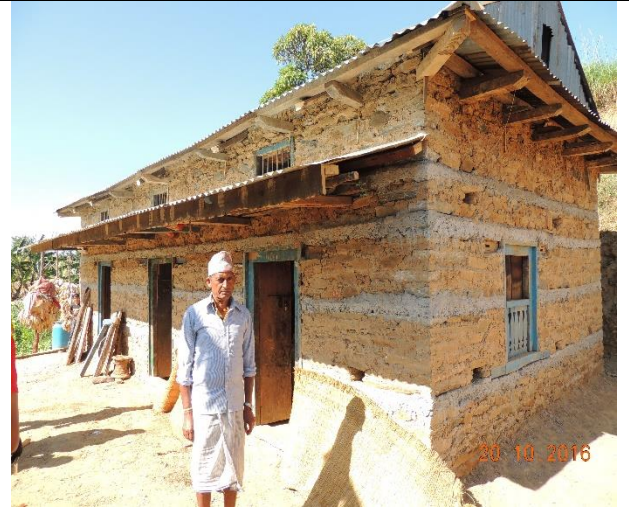
建造完成後的新屋帶給災民未來的希望