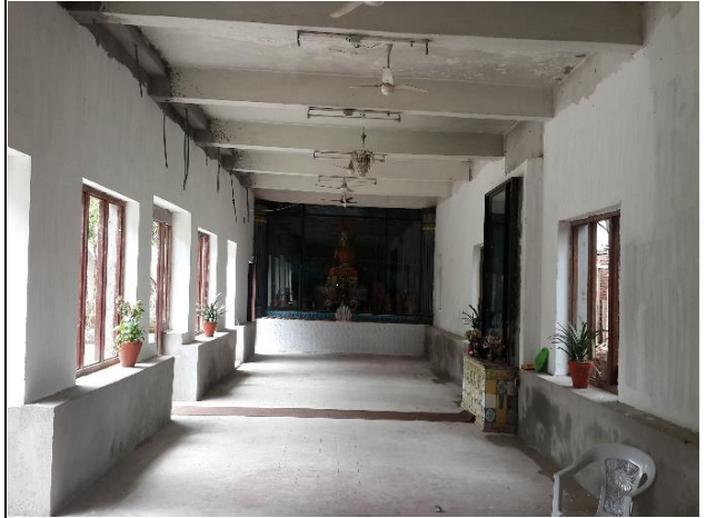
滿願寺整修後修行大樓內觀