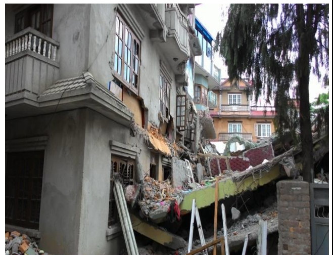
尼泊爾地震後原本三層樓的住宅已成廢墟