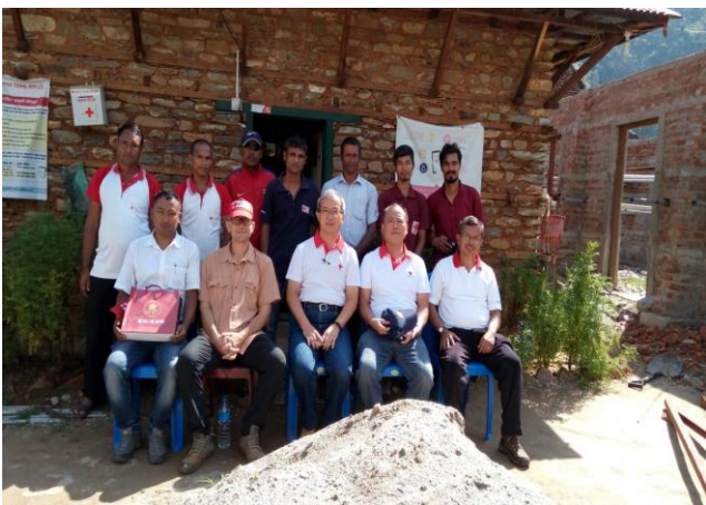
在新都里籌建基地樣品屋前全體合影留念。