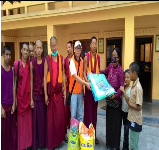
圓滿法洲寺雖然也有自己的困難，仍願伸出援手幫助瀕臨絕境的災民