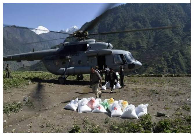
直升機賑濟物資卸載援助山區