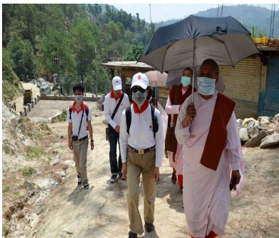
王會長與法師們深入尼泊爾災區察看