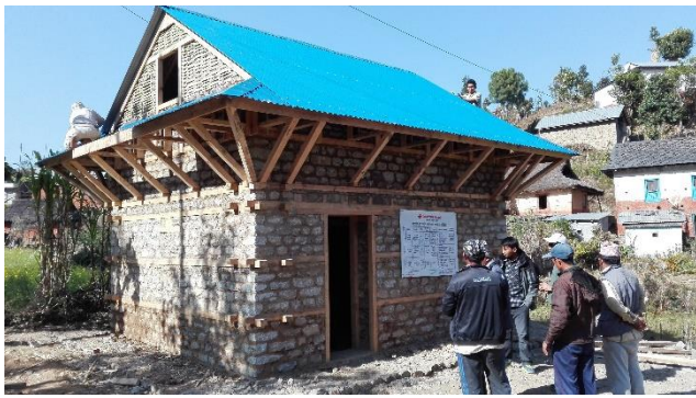
村民參觀瞭解國際聯合會(IFRC)援建之耐久屋