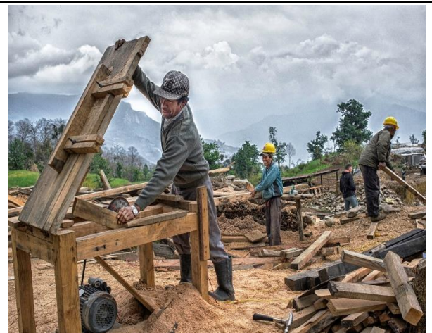
為了美好的未來積極展開重建復原工作