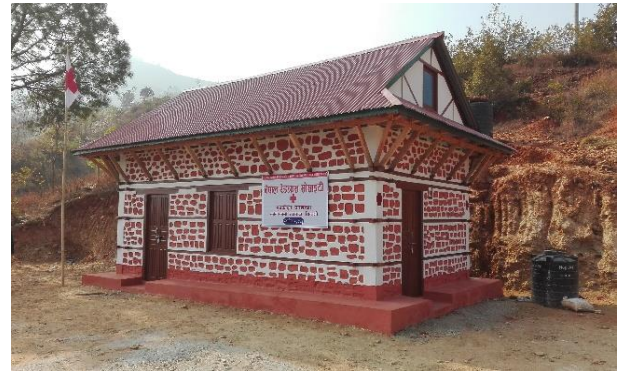
竣工的耐久屋提供災民安身立命之所