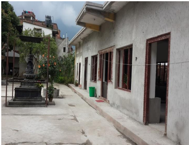
滿願寺整修後修行大樓外觀