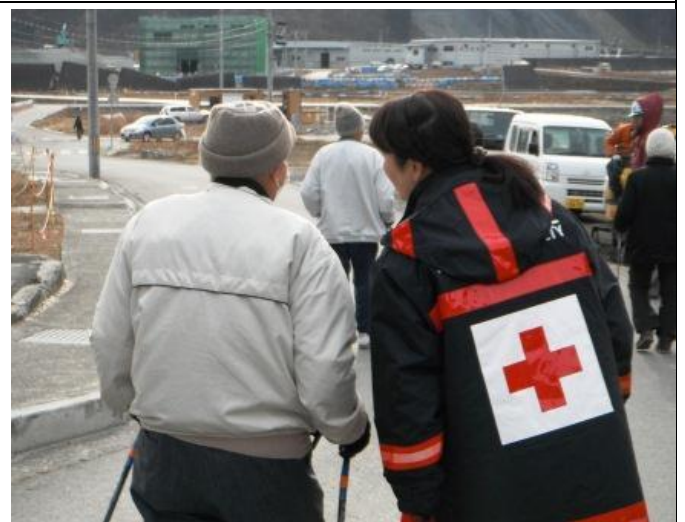
紅十字會志工緊密的陪伴著災後居民