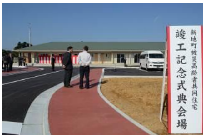
102 年 11 月 6 日舉辦完工典禮的福島縣新地町公營老人住宅落成典禮