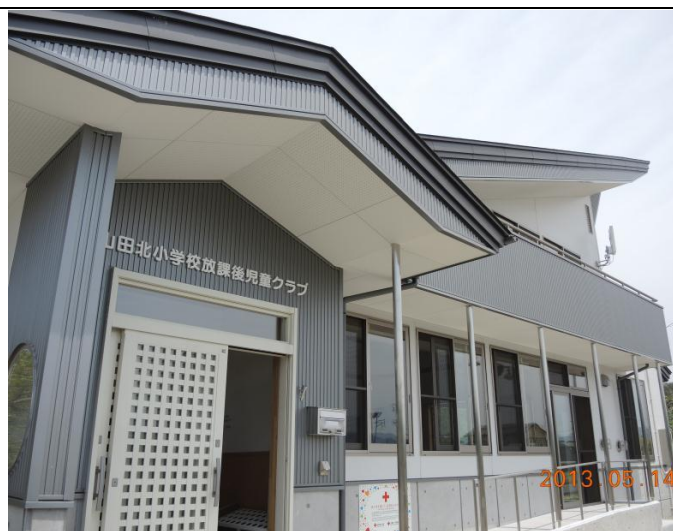
103 年 5 月 14 日新落成啟用的岩手縣山田町山田北課輔中心

縣氣仙沼市民福祉館等陸續完工落成，本會亦將擇要赴日參加竣工典禮及訪視援建，以為責信。其中宮城縣氣仙沼市民福祉館已於 106 年 4 月 14 日啟用，岩手縣大槌町 702 戶公營住宅，已完成 268 戶，餘因土地取得、設計規劃及施工等因素，全部專案項目日本赤十字社預計要到 108 年執行完畢。