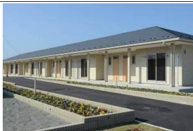
新地町公營老人住宅分為 A、B、C 三棟，並於社區內規劃戶外公共活動空間，總計 22 戶