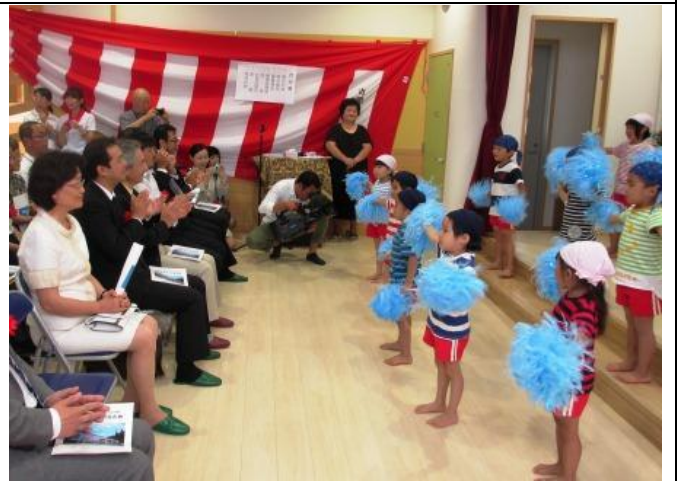
王會長參觀吉里吉里保育園落成典禮兒童表演