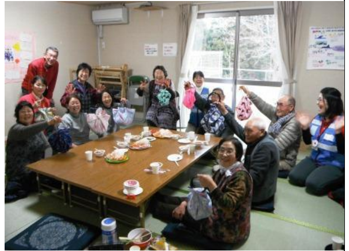
參加活動的災後居民都很滿意自己手工藝作品