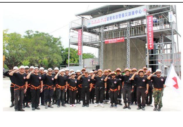
本會協助原鄉居民組成志工隊伍並進行訓練