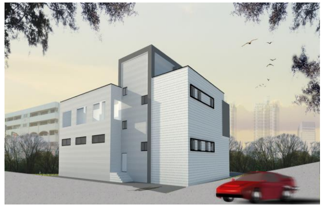
花蓮備災中心背面立面圖