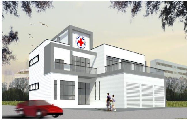
花蓮備災中心正面立面圖