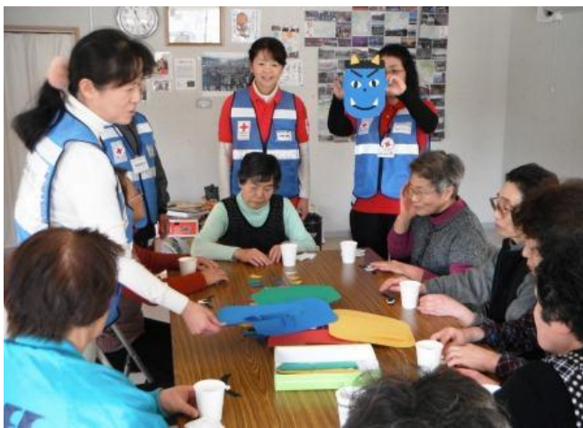
參加活動的災後居民開心地學習手工藝製作