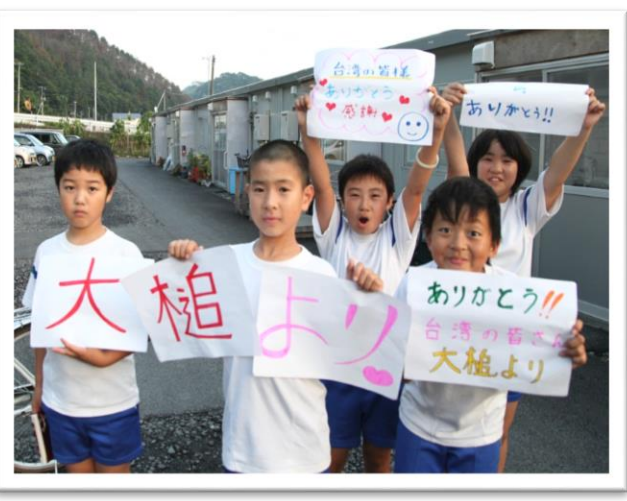
臨時組合屋的孩童，向我國援助者表達感謝