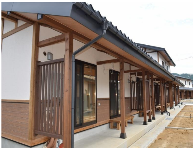
岩手縣大槌町大ヶ口社區(Ogakuchi) 70 戶公營住宅於 102 年 8 月底正式啟用