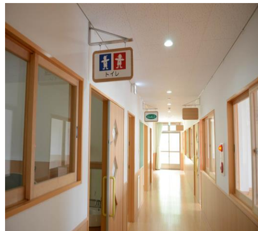
團員自由參觀內部設施、都覺得這間保育園的設備規畫相當完整