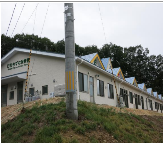
102年10月7日舉辦完工典禮的岩手縣山田町日台の絆保育園