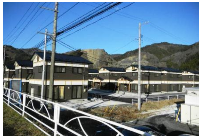
岩手縣大槌町公營住宅落成紀念牌感謝台灣