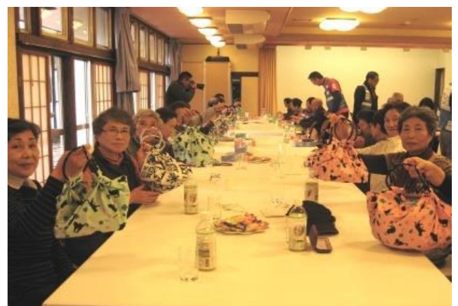
北歐式健走後居民參加午餐以及日本傳統包袱布手工藝品展