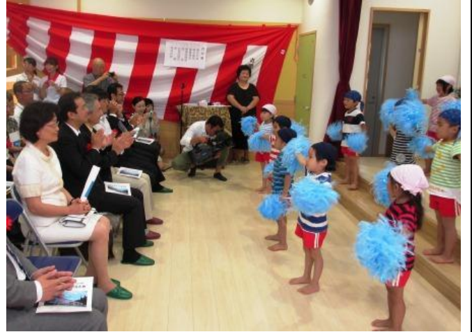
王會長參觀吉里吉里保育園落成典禮兒童表演