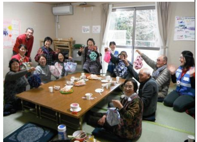
參加活動的災後居民都很滿意自己手工藝作品