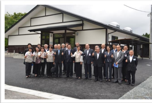
本會援建福島縣相馬市公營老人住宅，獲得日本優良建築「全建賞」住宅類獎。本住宅為「井戸端長屋」，以江戶時代「共用一口井洗衣」特色為設計理念，透過高齡者共同生活，預防孤獨感