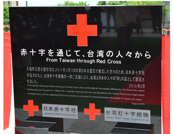
大槌町長碓川豊以「雨停後，不要忘了傘」這句古諺，表達日本對台灣 311 賑災無盡的感謝