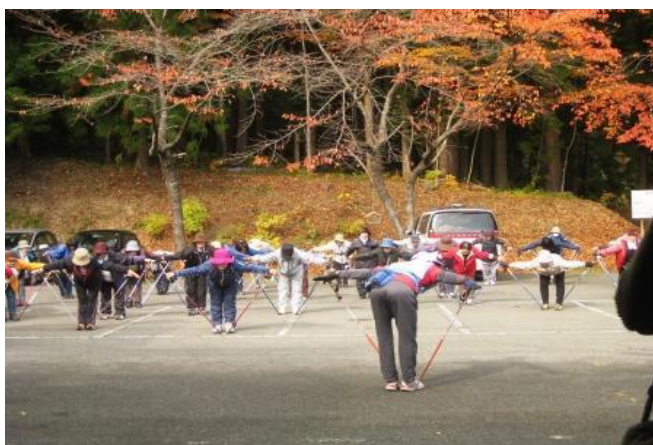
秋節過後居民參加社區所舉辦的北歐式健走