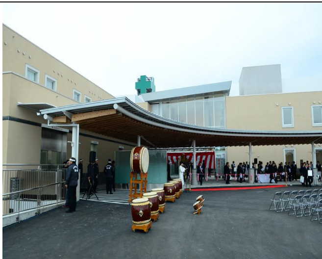
町立南三陸醫院外觀