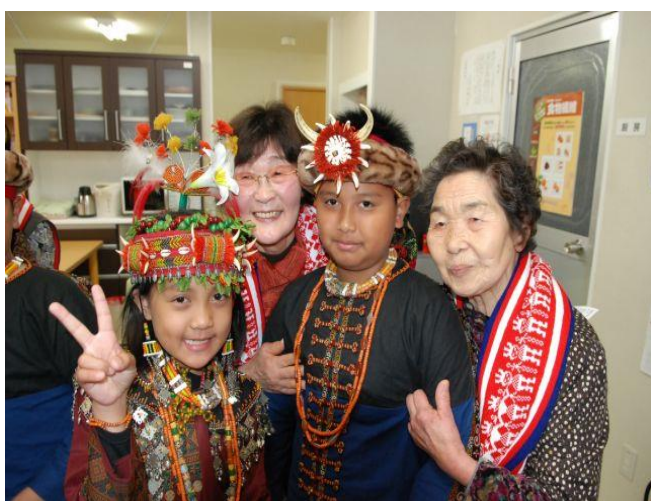
泰武國小古謠傳唱隊，赴日慰問當地受災長者