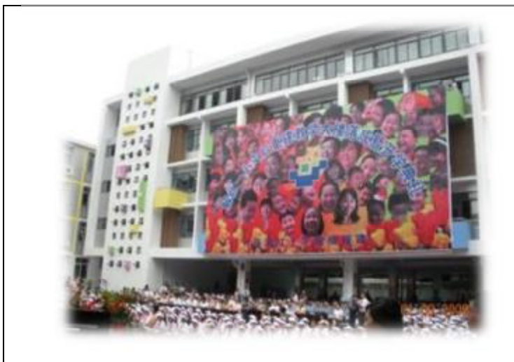
本會援建 43 所學校中，最早完工的成都市解放北路第一小學