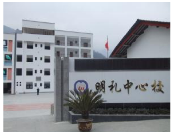
明禮鄉中心小學綜合樓