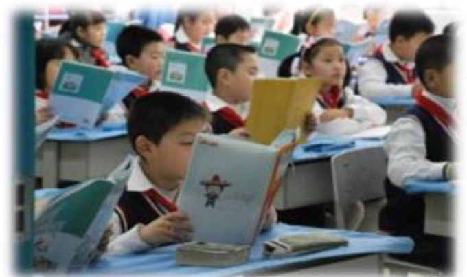
成都市解放北路第一小學學生上課情形。重建後的校園提供完善且多元的教育環境