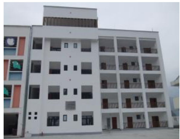
明禮鄉中心小學綜合樓