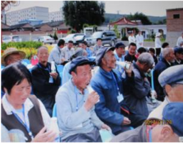
提供甘肅省天水老人院營養早餐，是弱勢關懷其中一項