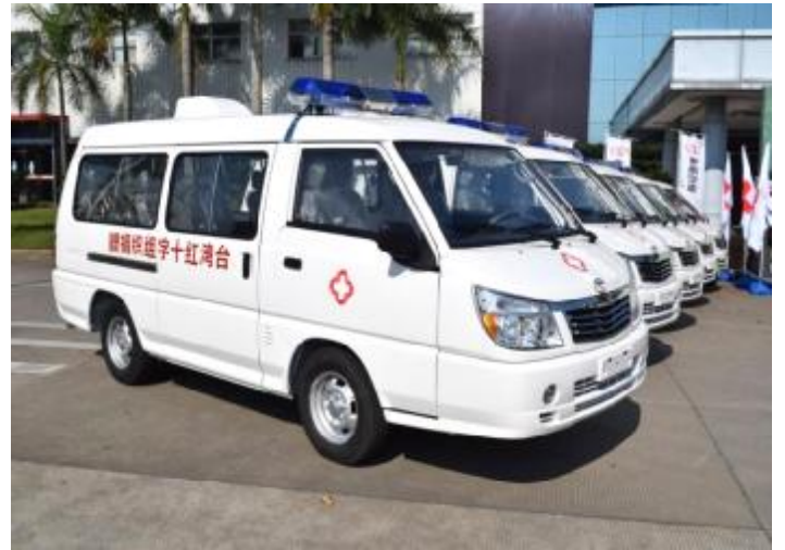
捐贈陝西勉縣衛生院 10 輛救護車暨車上救護設備