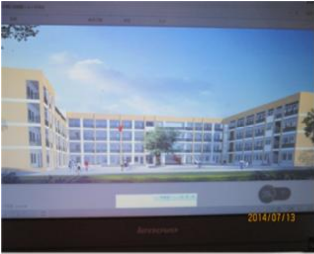
漢源縣九襄鎮第三小學示意圖