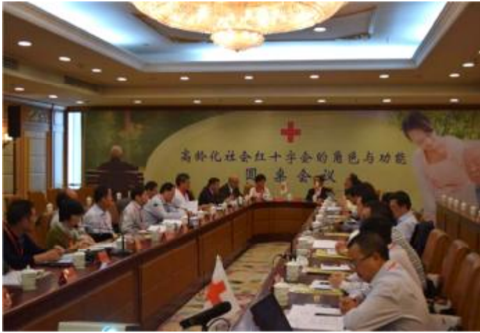
舉辦「高齡化社會紅十字會的角色與功能」圓桌會議