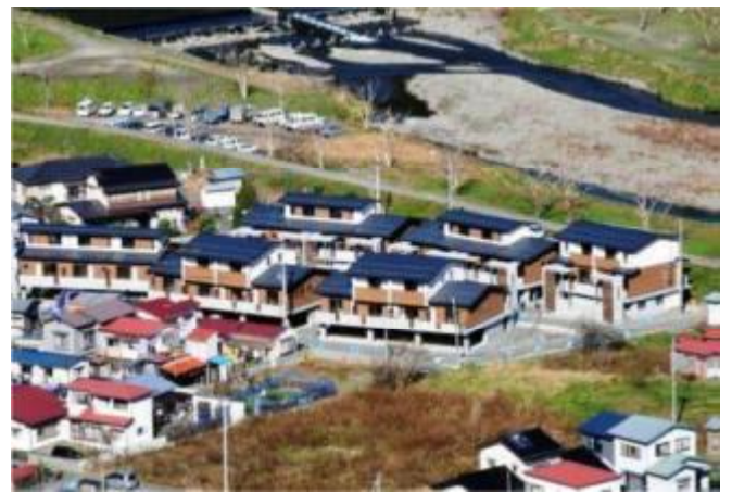
岩手縣大槌町 Gensui 公營住宅落成