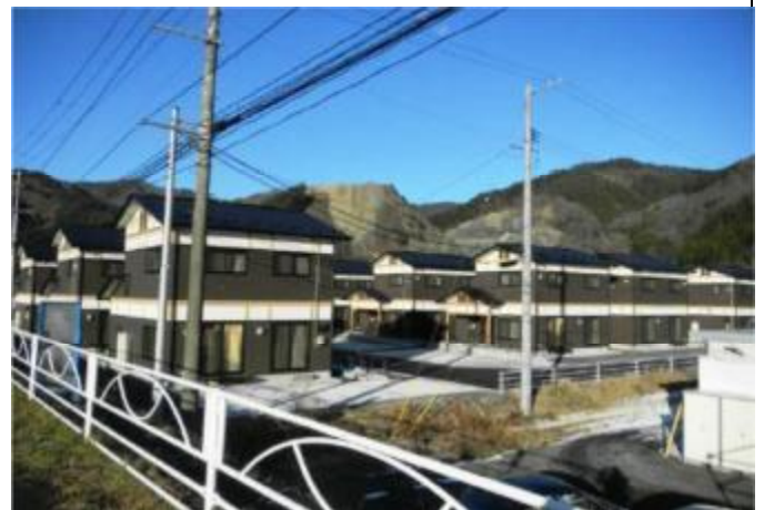
岩手縣大槌町 Masanai 公營住宅落成