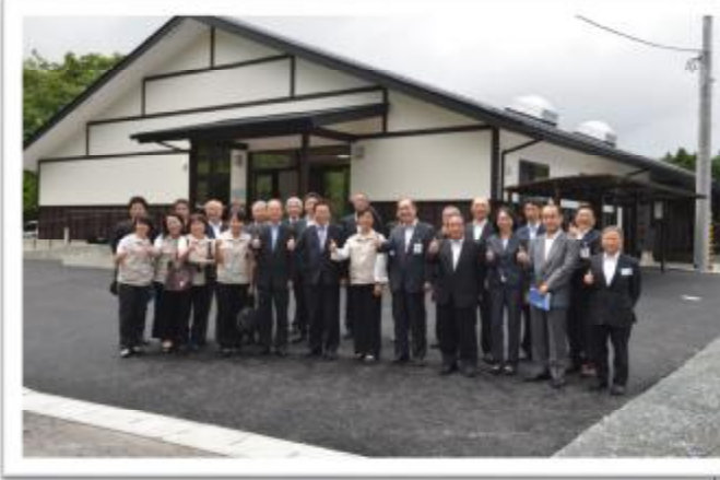
大槌町長碓川豐以「雨停後，不要忘了傘」這句古諺，表達日本對台灣 311 賑災無盡的感謝