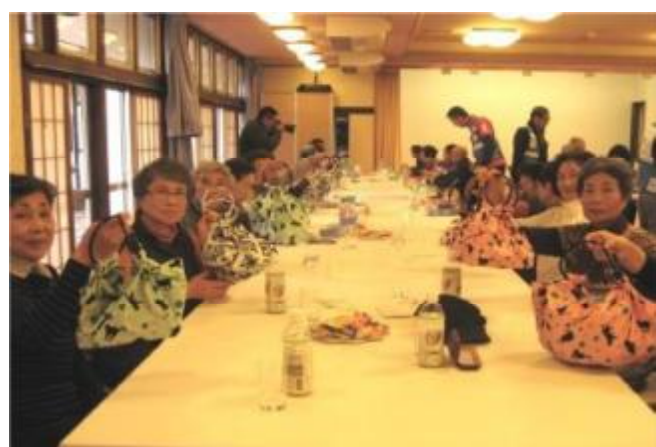
北歐式健走後居民參加午餐以及日本傳統包袱布手工藝品展