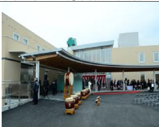
町立南三陸醫院外觀