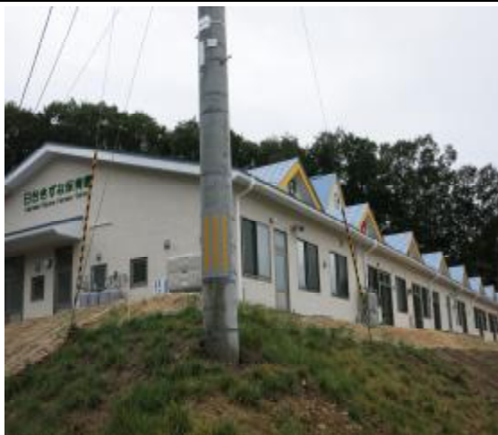
102年10月7日舉辦完工典禮的岩手縣山田町日台の絆保育園