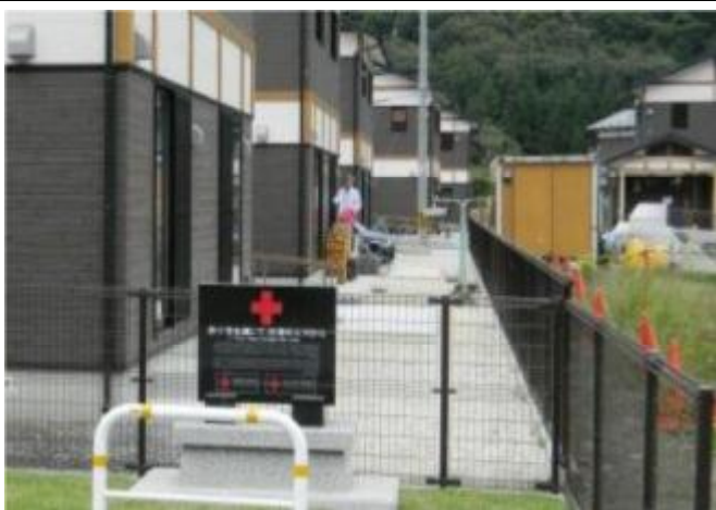
岩手縣大槌町公營住宅落成紀念牌感謝台灣