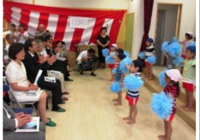
王會長參觀吉里吉里保育園落成典禮兒童表演