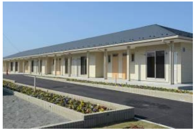
新地町公營老人住宅分為A、B、C三棟，並於社區內規劃戶外公共活動空間，總計22戶