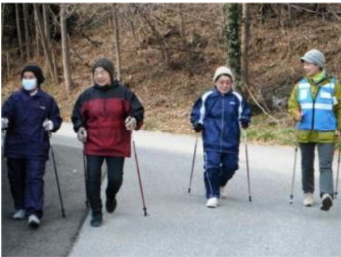
仍住在臨時住所的居民繼續北歐式健走鍛煉