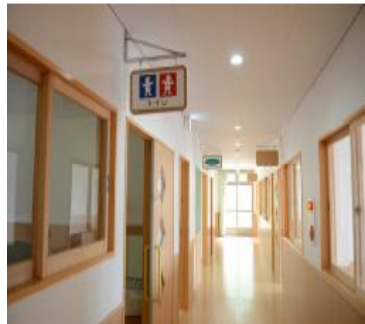
團員自由參觀內部設施、都覺得這間保育園的設備規畫相當完整