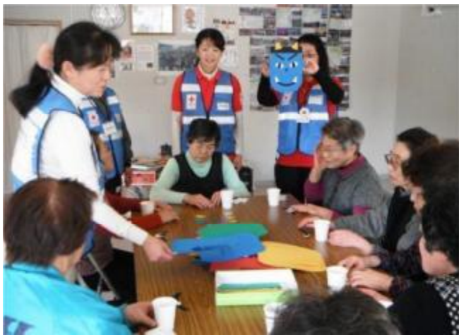
參加活動的災後居民開心地學習手工藝製作