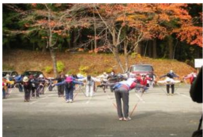
秋節過後居民參加社區所舉辦的北歐式健走