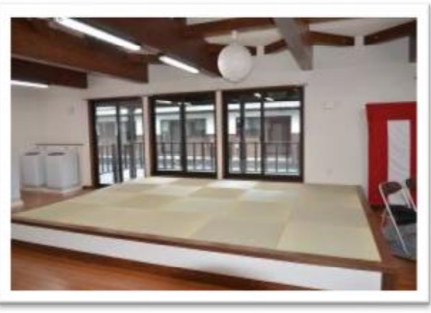
本會援建福島縣相馬市公營老人住宅，獲得日本優良建築「全建賞」住宅類獎。本住宅為「井戸端長屋」，以江戶時代「共用一口井洗衣」特色為設計理念，透過高齡者共同生活，預防孤獨感