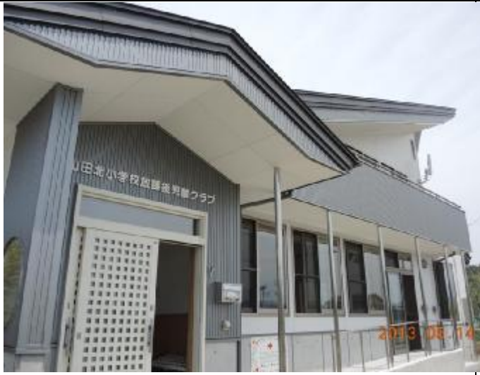
103年5月14日新落成啟用的岩手縣山田町山田北課輔中心