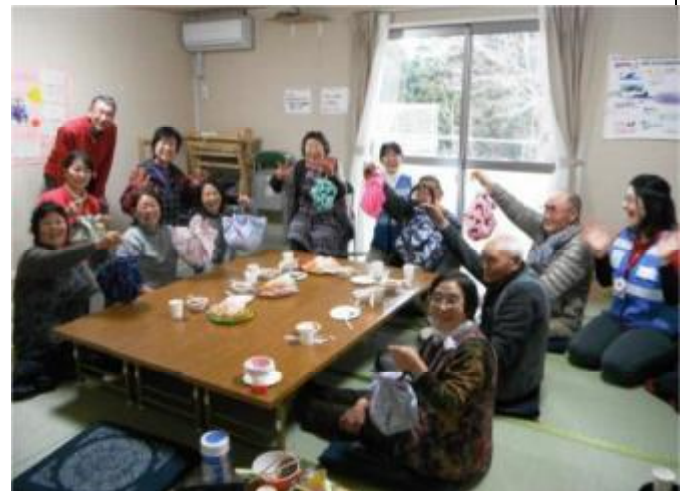
參加活動的災後居民都很滿意自己手工藝作品