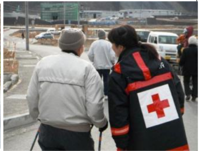
紅十字會志工緊密的陪伴著災後居民