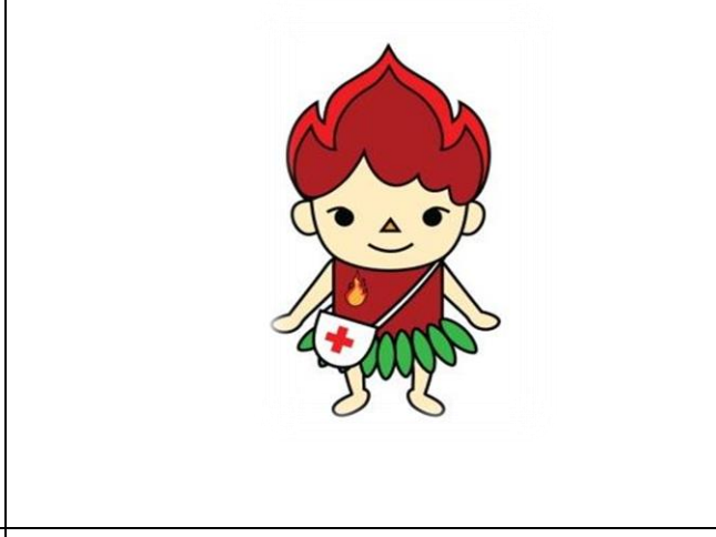
防災教材及影片主角「辟火精靈」。