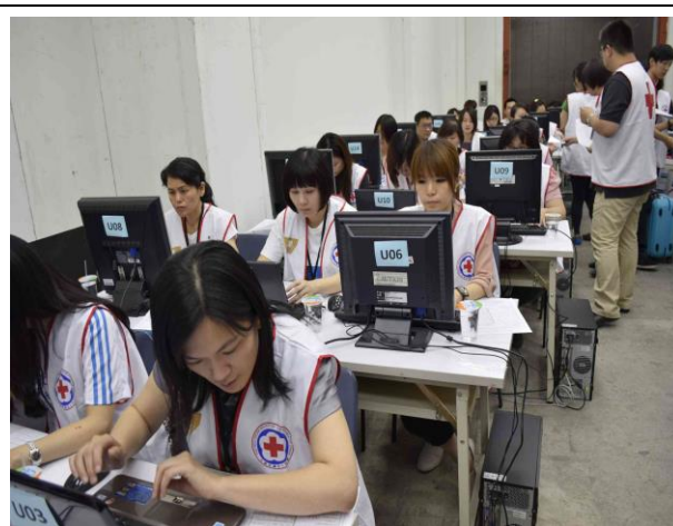
審核處理每一筆捐款，不負社會殷殷期待。