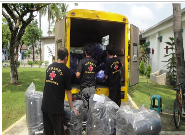
運補賑濟物資，支援收容安置工作。