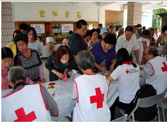
103年10月3-4日於高雄市五權國小發放屋損慰問金。