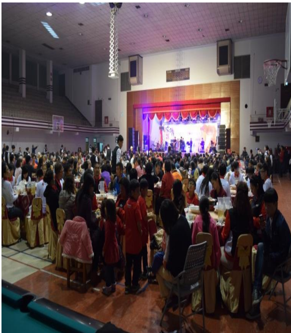
辦理歲末圍爐活動，傷者、家屬暨生和扶助戶 560 人參加。