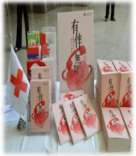
出版《有伴無驚-高雄氣爆的 30 個陪伴小故事》。