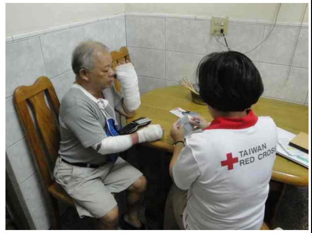
發放高雄氣爆傷者慰問金，祈願早日康復。