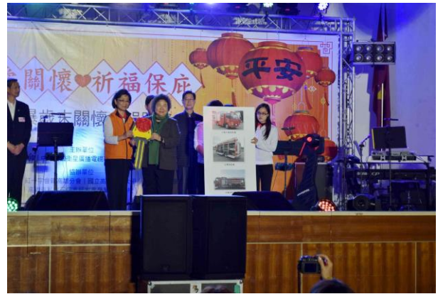
捐贈消防車輛與器材給高雄市政府消防局。