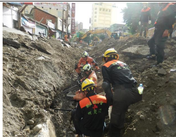
動員搜救志工，執行生命搜索救災任務。