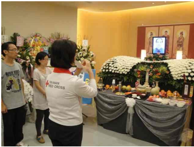
願生者堅強，願逝者安息--慰問罹難者家屬。