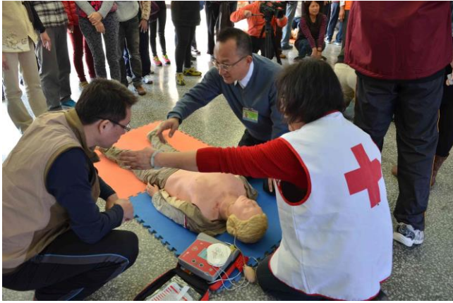
前進災區學校和里辦公室，推動急救訓練。