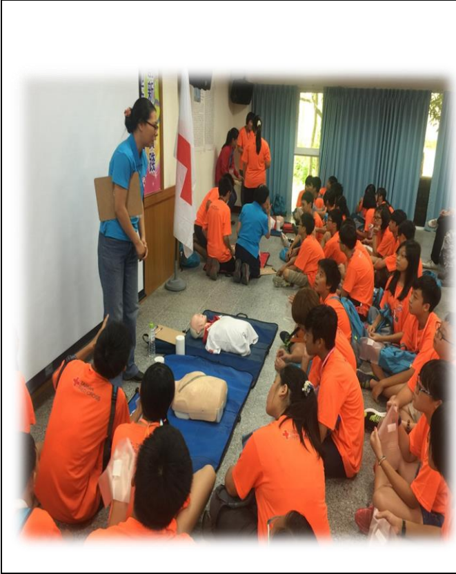
辦理防災夏令營，學員學習 CPR+AED。