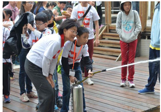
寓教於樂的校園防災教育宣導。