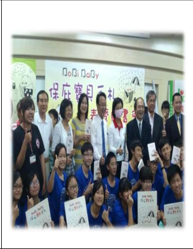
與張老師基金會合作辦理校園巡迴講座。