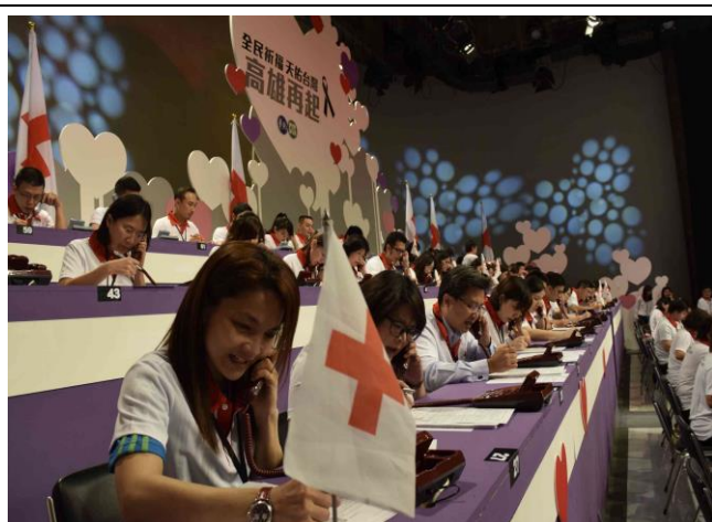
各界踴躍捐輸，協助災區同胞-電視募款晚會。