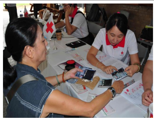
本會同仁為民眾說明修繕補助情況。