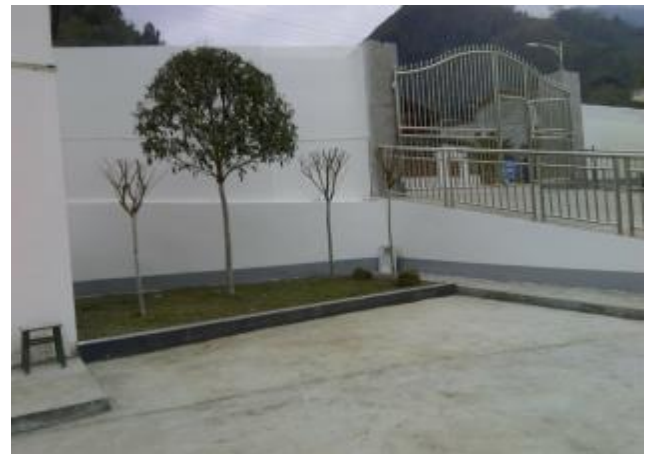
明禮鄉中心小學圍牆修建。