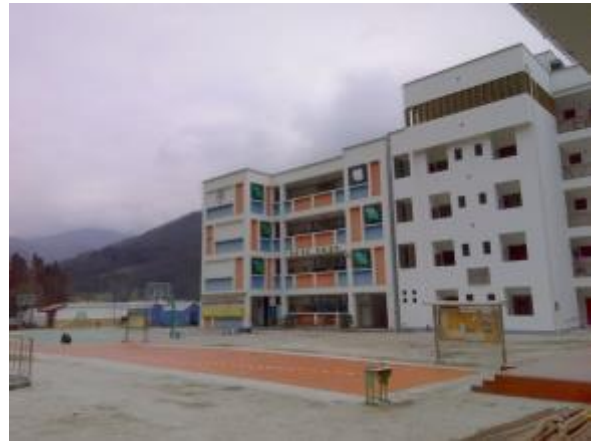
明禮鄉中心小學主體結構完成。