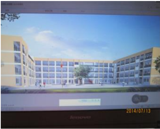
漢源縣九襄鎮第三小學示意圖。