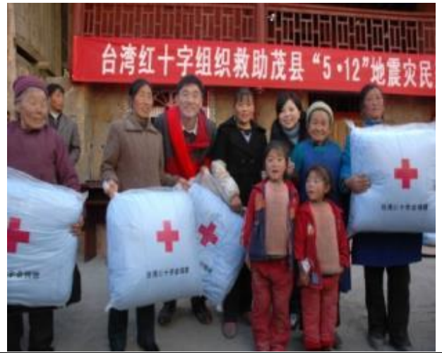
本會辦理冬季棉被發放活動，家園雖毀，但滿滿的愛心仍希望讓災民能夠度個暖冬。