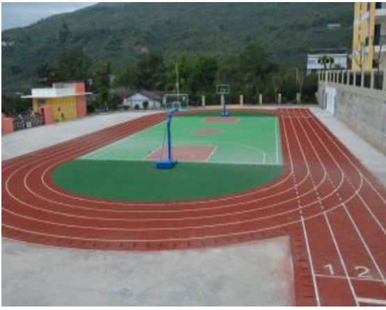
九襄鎮第三小學運動場、大門及圍牆。