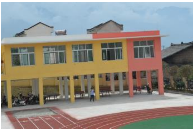
九襄鎮第三小學學生食堂。