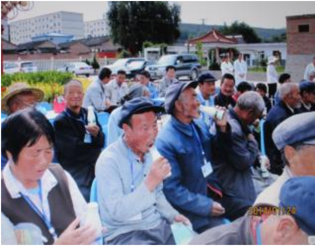
提供甘肅省天水老人院營養早餐，是弱勢關懷其中一項。