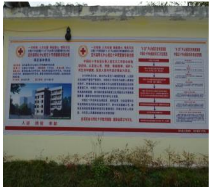
寶興縣明禮鄉中心小學示意說明圖。