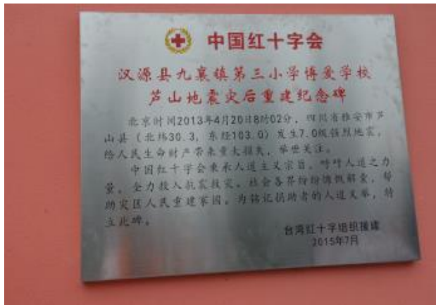
九襄鎮第三小學災後重建紀念碑。