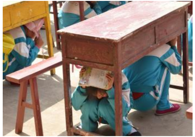
甘肅漳縣王馬咁村救備災能推廣的防災演練是全村村民、學生一起來。