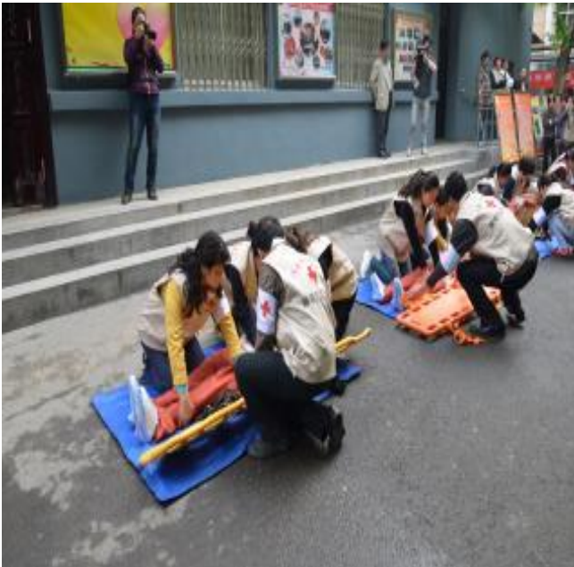
西安雁塔區東儀社區推動急救訓練，讓災難來時可以自救救人。