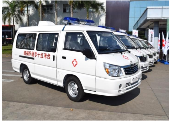
捐贈陝西勉縣衛生院 10 輛救護車暨車上救護設備。