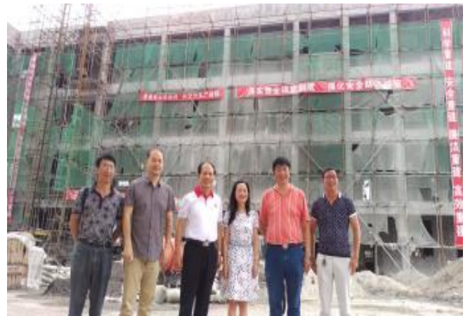
本會借台灣營建研究院、大陸紅十字組織等相關單位，至明禮鄉中心小學現地勘查。