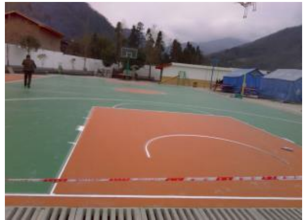
明禮鄉中心小學操場修建。