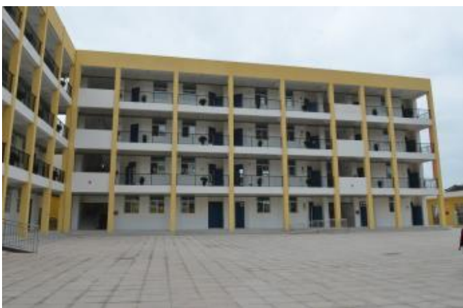
九襄鎮第三小學教學樓主體外觀。