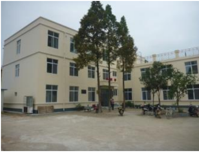
陝西省勉縣老道寺衛生院是本會援建 43 所衛生院之一，協助災後基層衛生系統的重建。