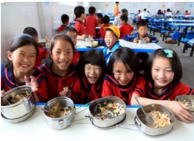
紅十字小餐盒關懷四川偏遠 8 個縣市的 49 個學校，2,400 位學生受益。