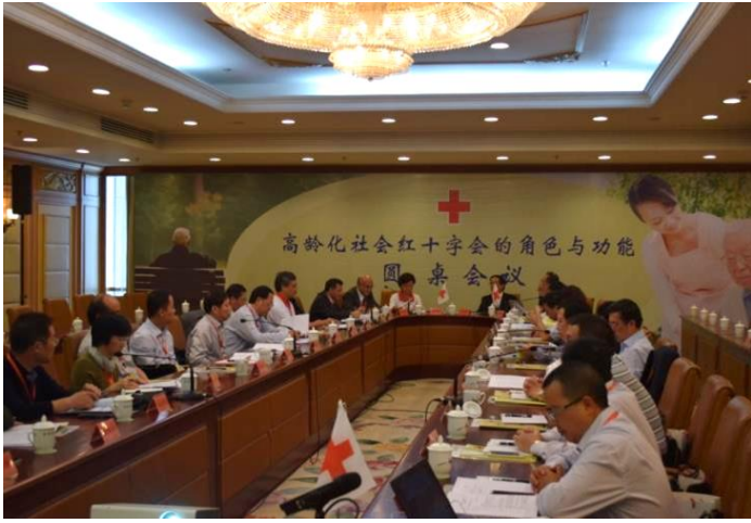
舉辦「高齡化社會紅十字會的角色與功能」圓桌會議。