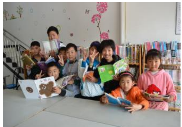
四川省中峰鄉社區服務中心的圖書館是孩子課餘最愛報到的地方。