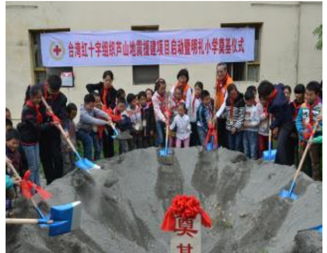
明禮鄉中心小學動土奠基儀式。