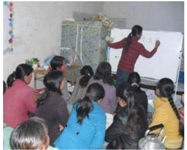
本會補助設立之甘肅省西和縣社區與生活重建中心，於當地舉辦社區活動及婦女識字班。