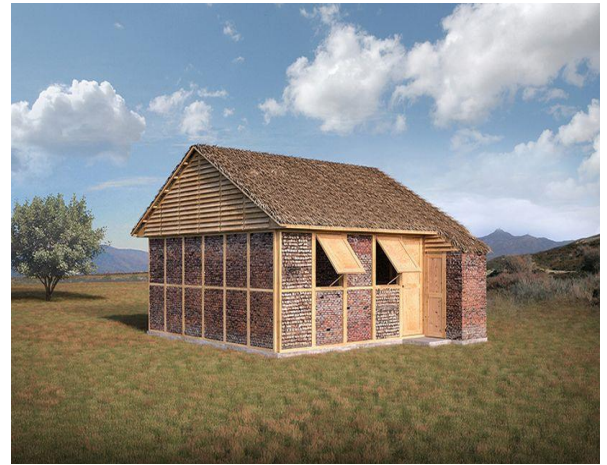
日本建築師設計之尼泊爾耐久屋示意圖。