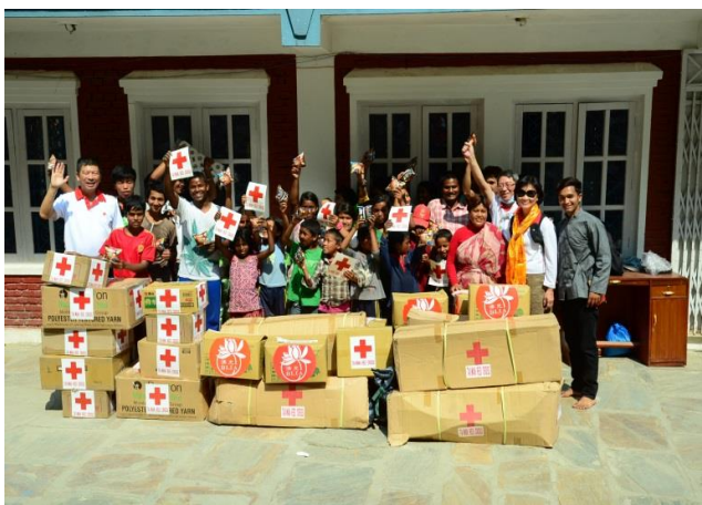
紅會關懷災區孤兒院院童生活。