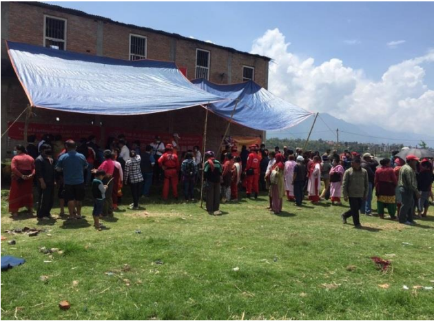
醫療站設立後，大量 Harisidhi 村民立即湧入尋求醫療協助。