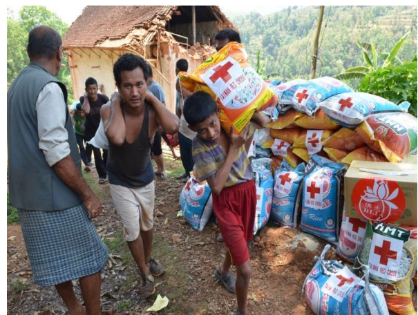
偏遠山區災民協助搬運賑濟物資。