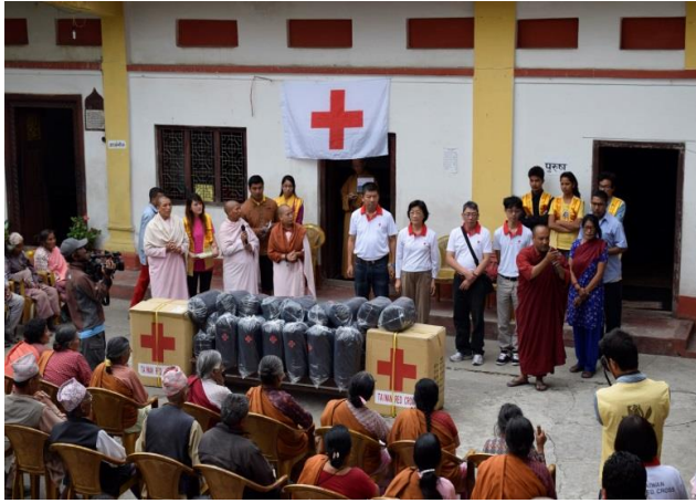
於滿願寺發放賑濟物資援助瀕臨絕境的災民。