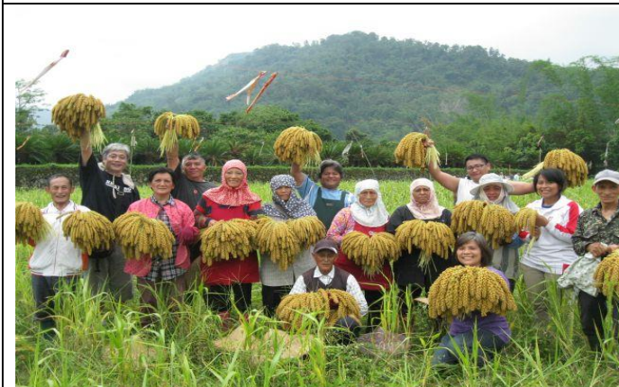
本會補助茶山雜糧產銷班小米收成，大家好開心。