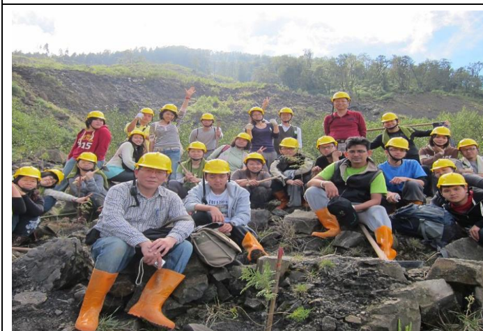
本會於災區與當地居民共同造林，保育大地母親。