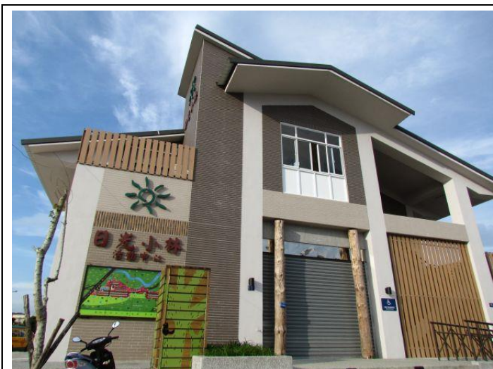
除了永久屋，本會也興建社區內的活動中心、產銷中心等設施，提供居民完善的社區空間。