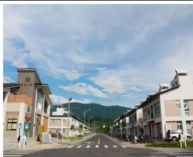
本會於高雄市杉林區興建「日光小林社區」，讓小林村民重新在這兒找回家鄉的感覺。