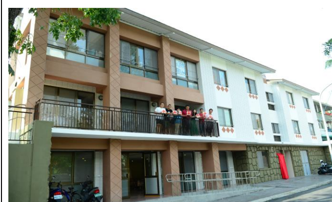
本會協助興建高雄市甲仙國中教職員宿舍，讓作育英才的老師們，在學校裡也有個家。