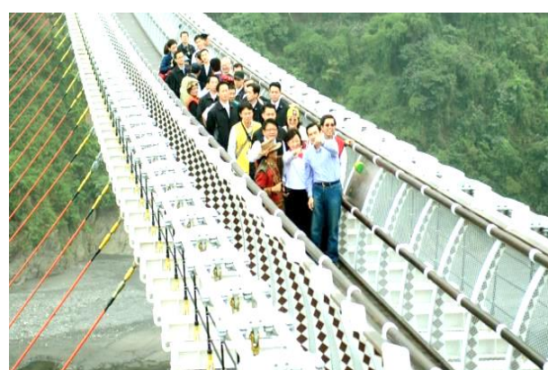
本會援建屏東縣三地門鄉山川琉璃吊橋，全長263.25公尺，是全國最長且優美的臥床式吊橋。