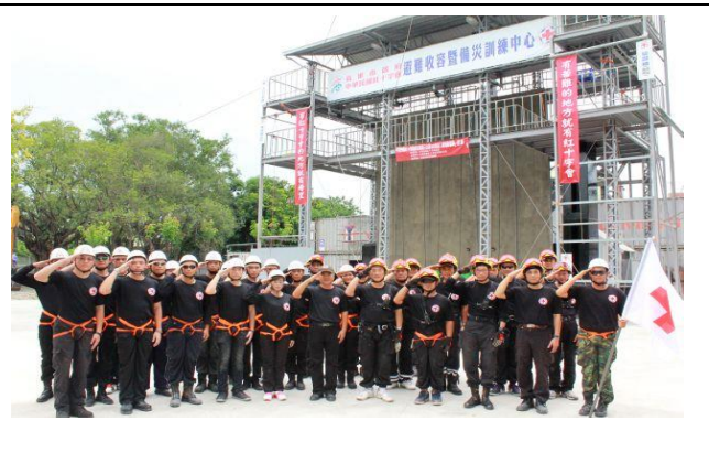
本會協助原鄉居民組成志工隊伍並進行訓練。