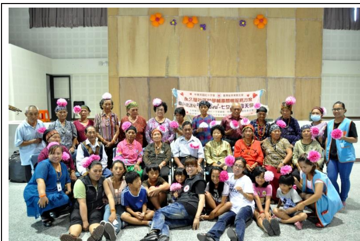
本會在吾拉魯滋部落推行老幼共學，透過日間關懷透過活動讓長者與稚兒更加親近，帶入年輕活力，傳承生命經驗與智慧。