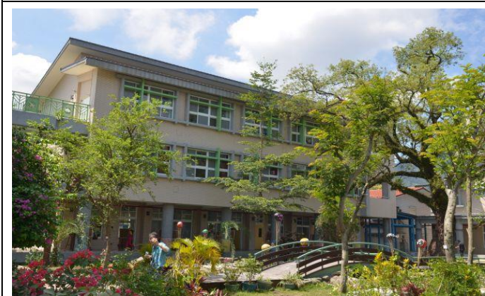
本會協助興建高雄市龍興國小，好漂亮的校舍。