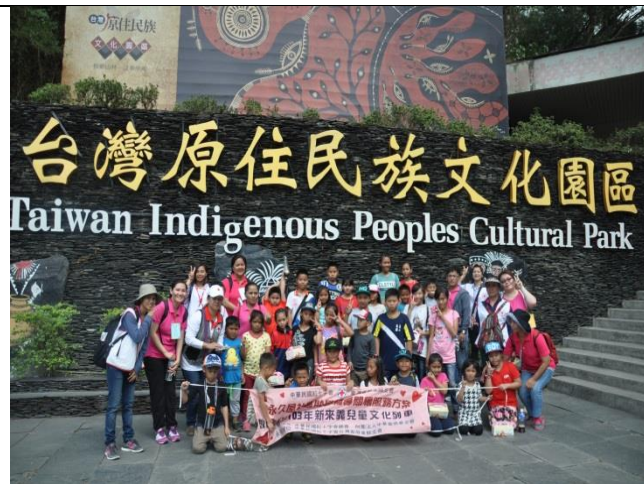
本會於重建區辦理排灣族兒童文化列車活動，建立自我文化認同、促進原民文化傳承。