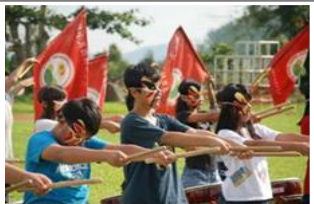
高雄市杉林國小融入創新的鼓術教學。