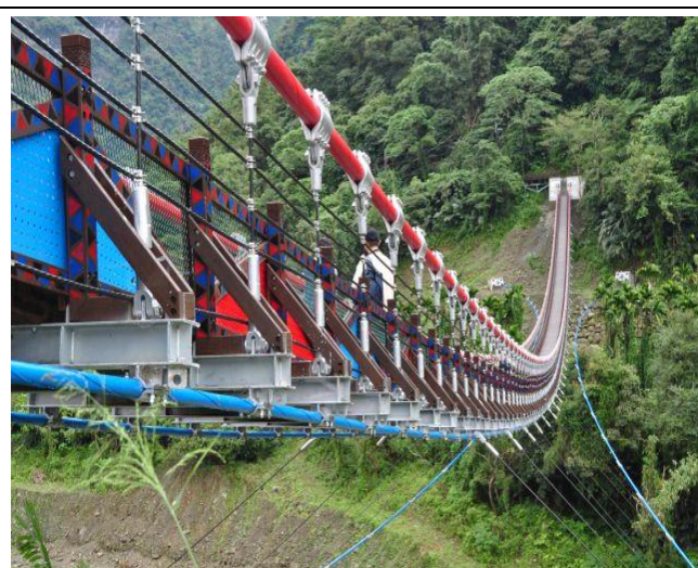
本會援建嘉義縣阿里山鄉福美吊橋，全長 176 公尺，是一座相當美的垂索式吊橋。