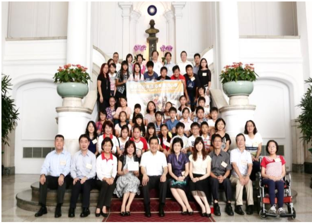
台南市海東國小以特色教學「科學教育」參加全球 虛擬教室競賽獲國際金牌獎，榮獲總統召見。