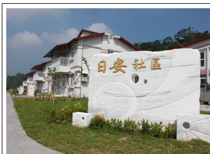
本會於嘉義縣番路鄉轆子腳基地興建「日安社區」，是本會第一個完工的永久屋社區。