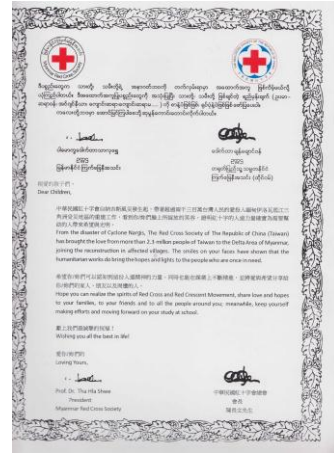
本會與緬甸紅十字會將加油祝福之訊息，連同 3,100 份學用品，致贈受災地區學童。