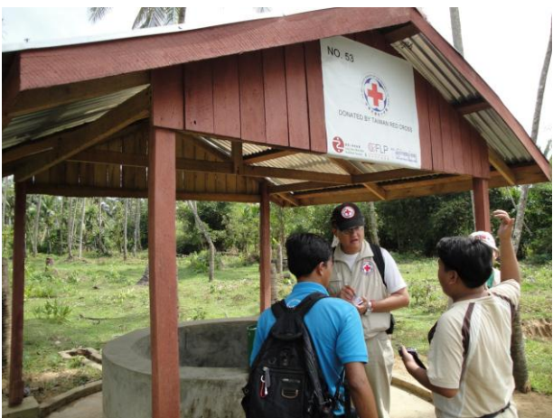
本會多次赴水井援建地區勘訪工程進度、確認水質，及了解當地居民使用情況。