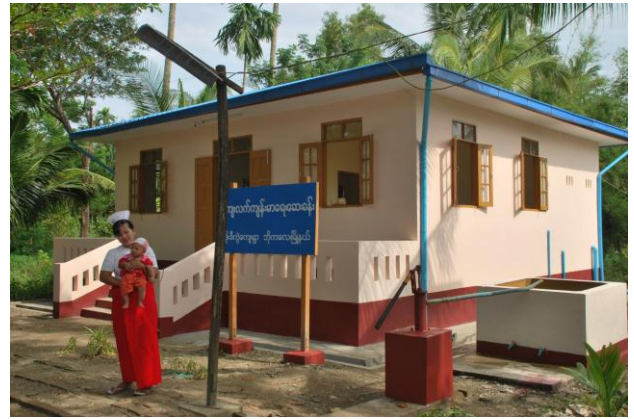
本會於伊洛瓦底江三角洲地區 Bogale 鄉 Phod Kwe 村援建之次級健康中心，服務範圍涵蓋鄰近 8 個村落，共 700 戶家庭、3,000 餘人。