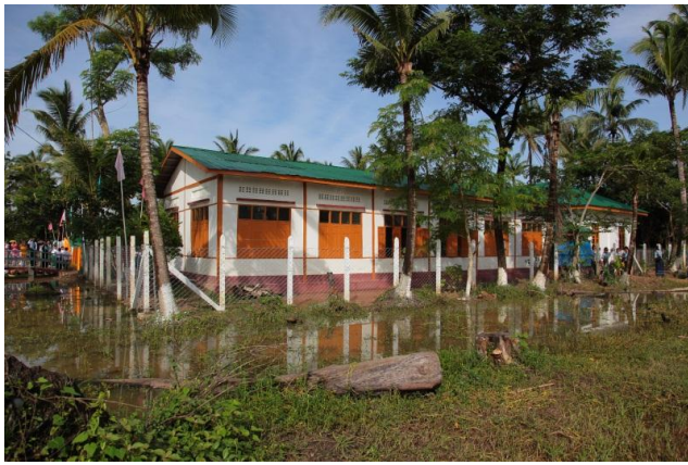
本會與靈鷲山合作援建之 MyoThit 小學教室外觀。