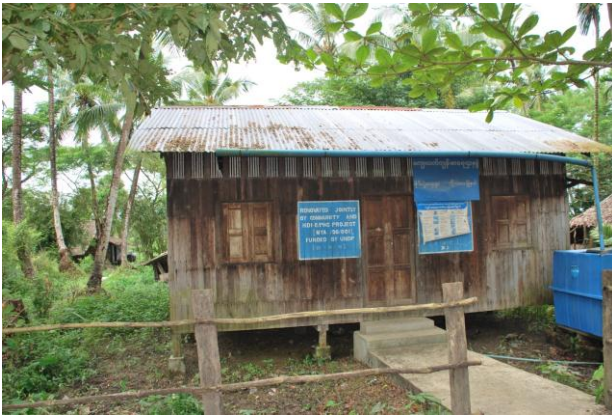
災區之原健康中心以茅草搭建而成，照明相對較為不足。