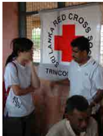
本會同仁與斯里蘭卡紅十字會 Trincomalee 分會員工商討行動醫療團事宜