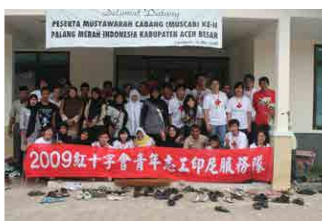
活動結束後，學員與工作人員們一同開心合照。