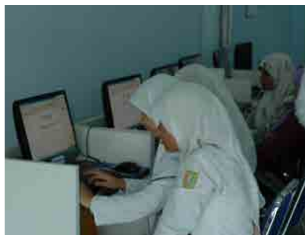
亞齊當地女學生運用本會提供之免費學習空間，上網擴大與世界之聯結