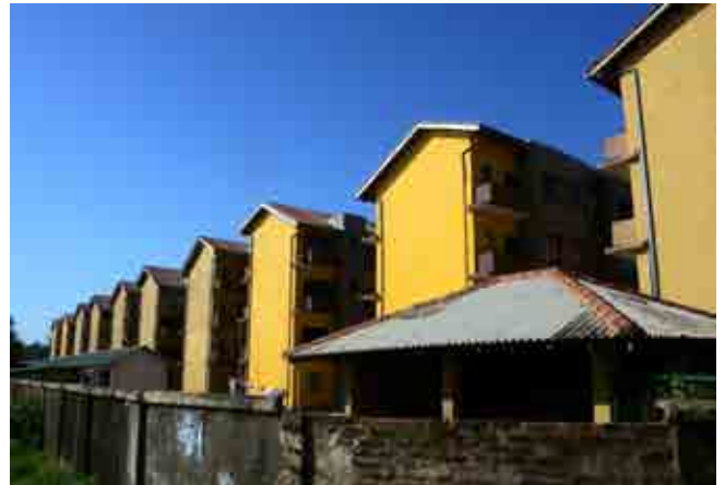
一字排開的房舍，規模十分壯觀— Lunawa 社區 80 戶