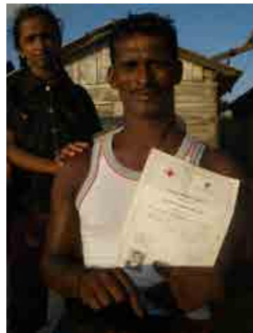
本會同仁於 2010 年 5 月探訪當初接受本會致贈漁船之漁民時，漁民主動拿出本會當初所頒發的證書，由證書保存良好的情況，想必漁民相當珍惜、愛護