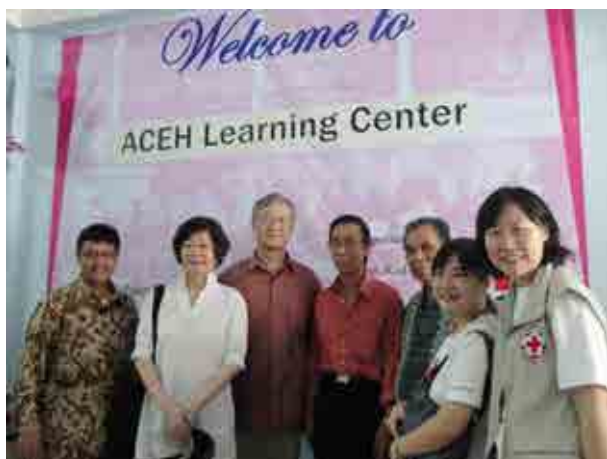
(左三)外交部駐印尼代表夏立言先生於本會援助之亞齊學習中心與本會同仁合影

亞齊學習中心因應南亞專案工作結束，於 99 年 12 月 30 舉辦感謝暨捐贈儀式，將該中心的電腦及裁縫設備轉捐贈給釋迦牟尼社區活動中心以及印尼亞齊省紅十字會，渠等將延續亞齊學習中心的精神，繼續開辦有關課程以服務社區居民，亞齊省紅十字會並表示規劃後續提供當地貧童繼續免費使用相關電腦設備。