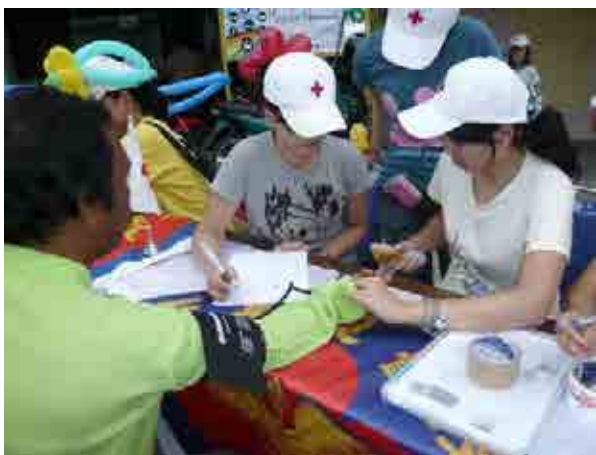
青年志工於服務期間，提供印尼亞齊居民量血壓等健康服務

每年服務活動結束後，必會針對每個服務地區的需求評估及服務方式，進行檢討建議，以期能帶給當地人更為重要且實用的衛教課程。在志工服務的意義上，志工們原以為志工服務就是為了服務他人；但在實際參與服務經驗之後，我們反而看到了這群青年志工們經由服務所獲得之自我成長及省思，在本會致力於推廣紅十字運動及國內青少年志工服務活動多年之後，如何培育國際青少年志工亦是一可資思考之方向。