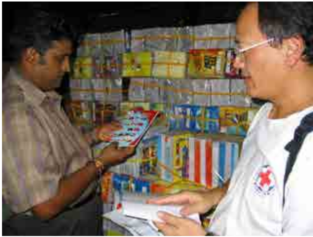
緊急救援階段，本會分別於印尼及斯里蘭卡當地採購民生物資