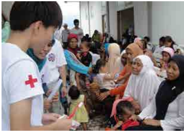
青年志工示範如何正確刷牙