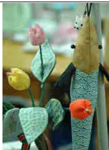
亞齊婦女運用所學所製作的拼布