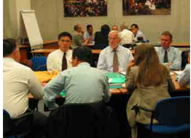
郝前秘書長應邀出席國際聯合會於日內瓦總部舉行之「海嘯協力與責信會議」