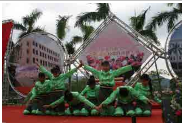
亞齊學生在景文科大校慶中表演傳統舞蹈

更特別的是，這16名學生中，有部份同學在返回印尼前夕，與其他印尼在台僑生透過以自行車環騎台灣的方式，感謝台灣社會對於印尼的幫助，承諾將秉持感恩的心，走入社會，協助更多需要幫助的人們。