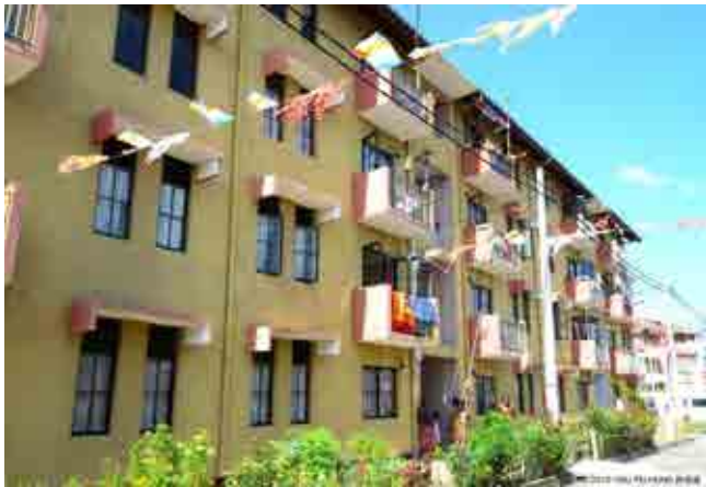
溫暖、實用的房舍—Kadawalawatte 社區 112 戶