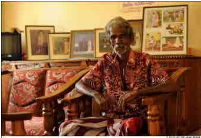
老先生力邀紅十字會同仁進入家中參 觀、拍照