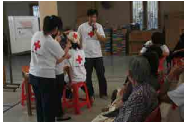
佛堂的婦女們，專心的看著台上講師示範三角巾包紮。