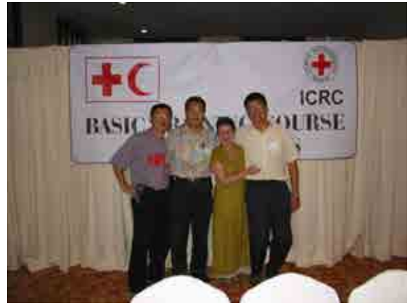
本會首次派員參加聯合會派駐海外工作人員之 Basic Training Course 訓練