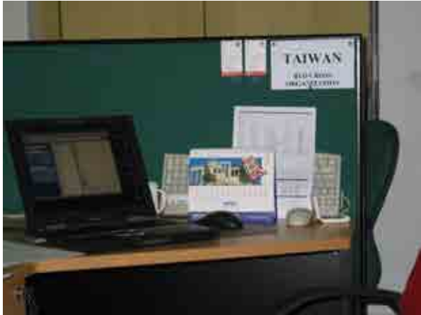
本會 2005 年 3 月駐斯里蘭卡可倫坡聯合會協調中心座位