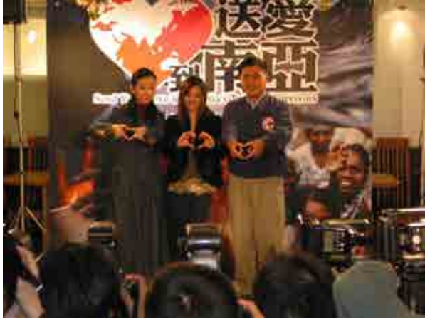
「送愛到南亞」募款活動獲得台灣演藝界、媒體界全力支持