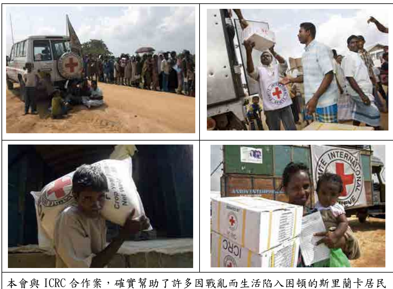
本會與 ICRC 合作案，確實幫助了許多因戰亂而生活陷入困頓的斯里蘭卡居民

自 97 年 10 月以來，ICRC 是唯一留守在斯國北部交戰最激烈的 Vanni 區域從事救援的國際組織(當時聯合國已暫時撤離)。98 年初在 Vanni 區域，救援用的醫院或救護車頻頻遭到砲擊，類此暴力事件使 ICRC 在相當困難的環境下展開救援工作。