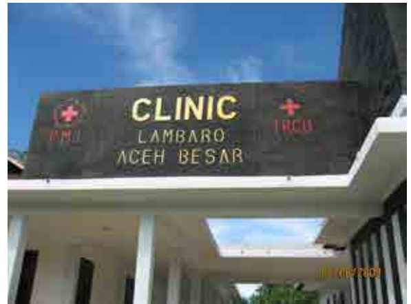
本會所援建診所之一：Lambaro 診所