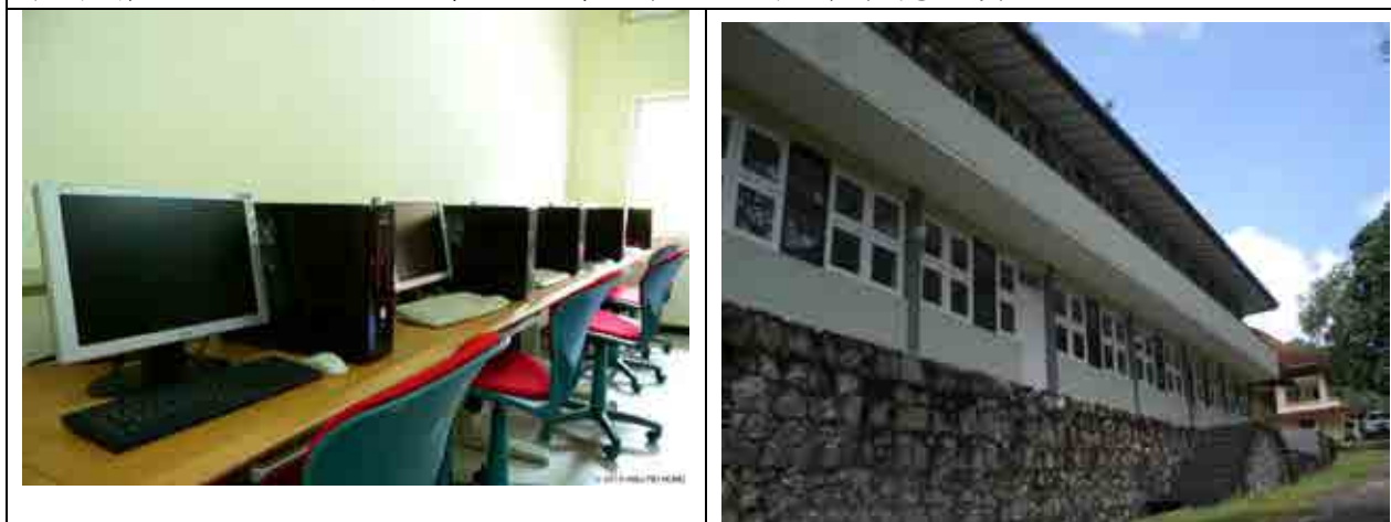
本會援贈之電腦教室，協助孤兒院童更完善的教育設備