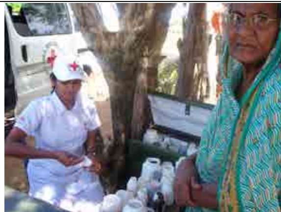
在鄉野間進行的醫療服務，吸引相當多民眾前來接受基本的醫療治療