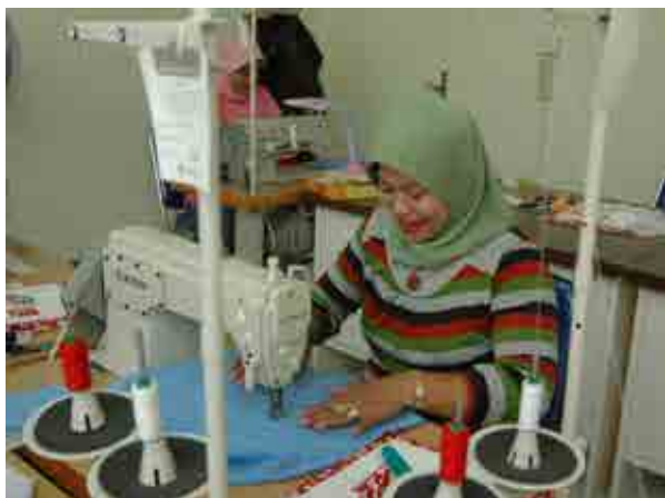
本會開設的縫紉課程，吸引許多婦女前來學習縫紉技能、增加收入