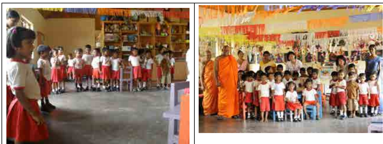
在本會援助下，幼稚園學生擁有更良好的教育環境及資源

為使資源貧乏的院童們能有更多的學習資源，本會另於孤兒院內興建兩間電腦教室、捐贈 20 台桌上型電腦，對於沒有用過電腦的院童而言，除了電腦的新奇有趣外，電腦的便捷性及與世界資訊接軌的豐富性，讓院童們終於在學習資源上與一般學生無異，大幅提升院童們課業上的成績及電腦能力。感受到教育之於院童的意義，本會隨後又援助了孤兒院圖書館暨職訓教室的興建工程及購置書籍與木工器具、裁縫機等職訓工具的經費，除增加院童閱讀的機會外，更鼓勵院童在成年(18 歲)離開孤兒院後，能帶著一技之長自力更生。