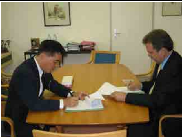
郝前秘書長與國際聯合會秘書長簽署備災與組織發展專案計畫第五階段備忘錄修正案