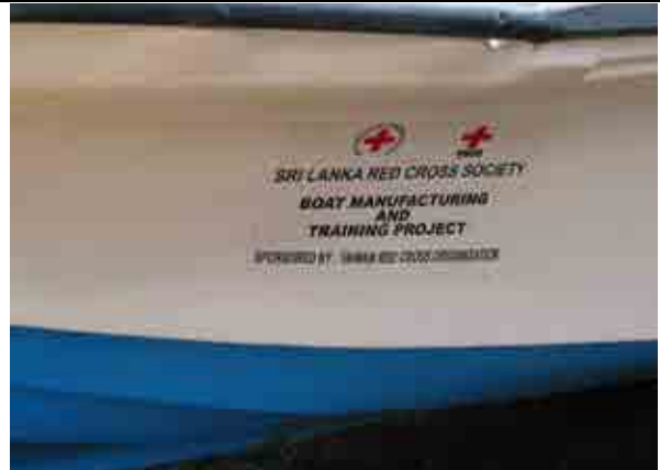
本會所造贈的 550 艘漁船在 2006 年底 前，全數製造完成並分發予需要的漁戶