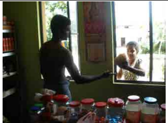
Kadawalawatte 社區居住在一樓的居民 運用空間，開設一間小雜貨店經營小本 生意