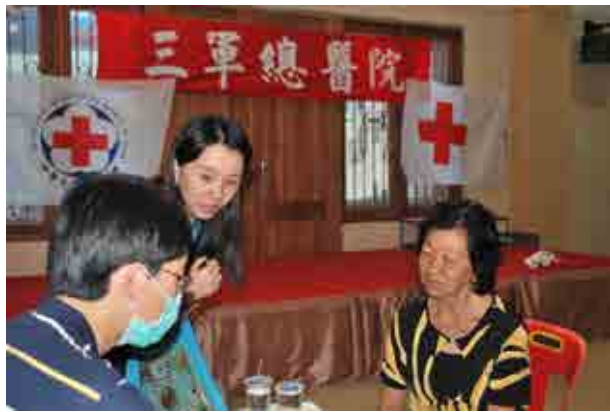
本會於四診所落成啟用之際，與三軍總醫院合作，進行義診活動