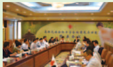
「高齡化照護」已成世界性重要課題,兩岸紅十字會於福州合辦圓桌會議,彼此交流