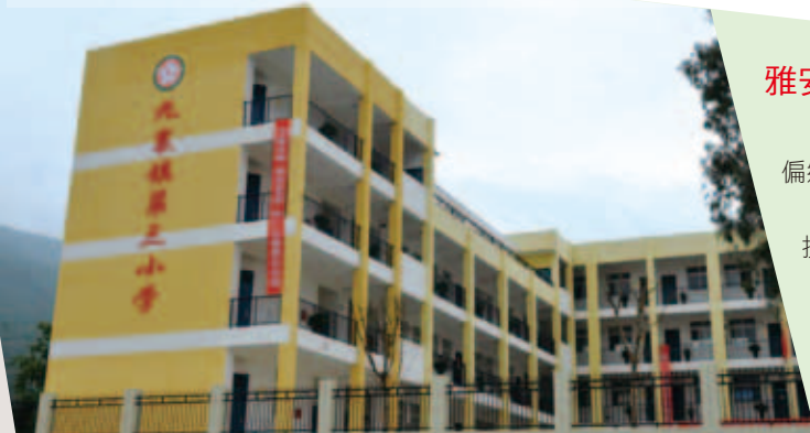
雅安市漢源縣九襄鎮第三小學校舍落成,紅布條寫著「地震無情,人間有愛,我們在感恩中前進」

汶川專案(含雅安)執行至今7年又8個月餘。繼2014年8月,今再向各位捐款人致上感謝並提出報告。