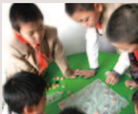
兒童福利聯盟文教基金會於四川德陽綿竹縣從事災後兒少關懷,孩子以棋會友

本會補助四川阿壩州松潘縣牟尼鄉石壩子村改種高經濟作物中藥材羌活,取代薄利的農作物菜心