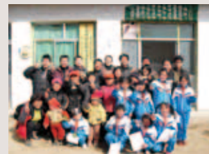
海棠文教基金會投入甘肅隴南西和縣蘇集村培力在地社工,與孩子彩排春節節目

汶川震後至2013年間,本會組「512川震臺灣服務聯盟」於災區提供心靈重建服務,成立3處社區與生活重建中心,積極培訓在地社工,傳承臺灣經驗。