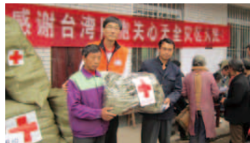
雅安賑災先遣評估小組深入災區勘災、賑濟12天

本會報內政部同意，自汶川專案提撥500萬人民幣，連同2,900餘萬元捐款(含利息)投入緊急賑濟及後續重建，包括支持寶興縣明禮鄉中心小學及漢源縣九襄鎮第三小學興建大樓，嘉惠偏鄉子弟，2016年1月全數完工。