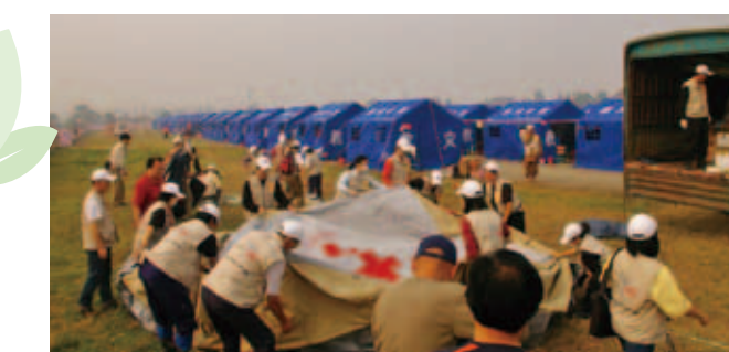
汶川震後，本會醫療團於四川省廣漢市展開緊急醫療行動

汶川地震 ：2008年5月12日14:28 芮氏規模8 震央位置 ：四川省汶川縣映秀鎮附近 傷亡情況 ：近10萬人罹難，逾36萬人受傷， 4,555萬餘人受災 緊急救援 ：第一時間捐助美金30萬元並成立勸募專案，協調華航兩度協運帳篷、毛毯、睡袋等百噸以上物資馳援。期間搜救隊、醫療團深入重災區，協助尋獲15名罹難者、服務傷病患630人。