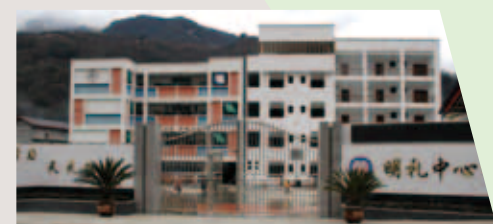
雅安市寶興縣明禮鄉中心小學綜合樓(右棟)