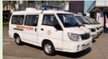
本會捐贈10輛救護車暨配備給陝西漢中勉縣衛生院