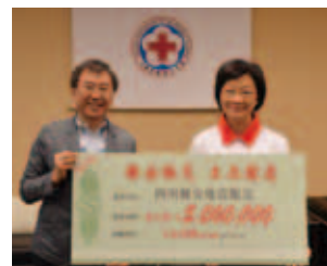
雅安地震王品集團捐款500萬元，亞太郵輪、台南康寧大學、中鼎工程等，皆捐款賑災

緊急救援 ：撥付100萬元人民幣採購醫藥器材、日用品及搭建流動廁所等。4月22日派出先遣評估小組，攜帶1萬2千份消毒錠及手電筒赴災區，28日及30日華航兩梯次協運毛毯4,527條及6人帳篷500頂至成都，由同仁深入雅安市天全縣老場鄉小落村執行全村覆蓋式發放。