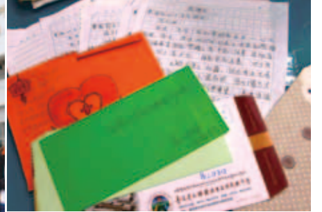
寒梅學生的感謝信

災後第一時間，本會即向大陸紅十字組織表達關懷，並發起募款活動，立即撥付 10 萬美元，供災區紅十字會購置救災車輛及物資。此外，也與台北市立聯合醫院、桃園壢新醫院、成大附屬醫院組成紅十字會醫療隊，包括急救、骨科、家庭醫學、小兒科及公共衛生等 6 位醫師、7 位護理人員及 2 位藥劑師，趕赴當地提供醫療救援。